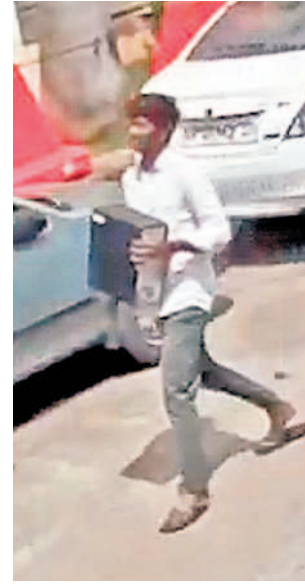
కార్యాలయంలోని సీటీయూను తీసుకెళ్తున్న యువకుడు