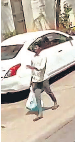
కారు వద్దకు దబ్బు సంచని తీసుకెళ్తున్న కార్యాలయానికి చెందిన మరో సిబ్బంది