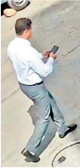
బంజారాహిల్స్ రోడ్డు నంబర్-10 లోని పాంగులేటికి చెందిన రాఘవ కన్స్ట్రక్షన్ ఆఫీసర్ కీలక వ్యక్తి