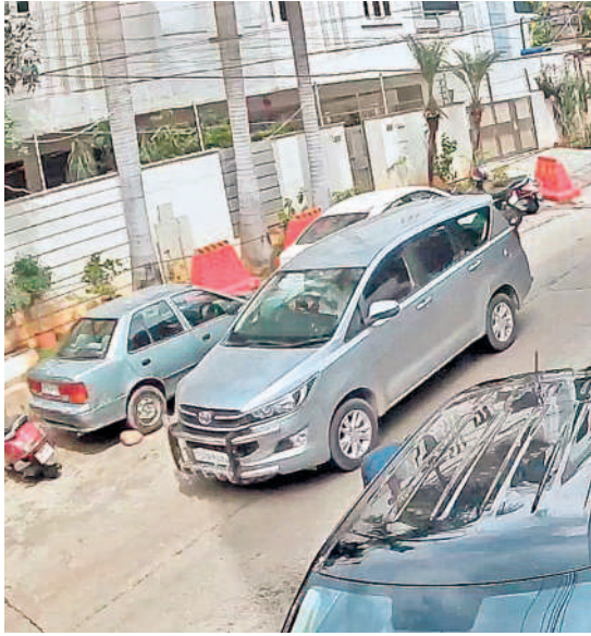
బంజారాహిల్స్ రోడ్డు నంబర్-10లో కారును రహస్య ప్రదేశంలోకి తీసుకెళ్తున్న పాంగులేటికి చెందిన రాఘవ కన్స్ట్రక్షన్ కార్యాలయ సిబ్బంది