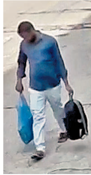
నోట్ల కట్టలున్న ఒక సంచని, బ్యాగ్/గును తీసుకెళ్తున్న మరో వ్యక్తి