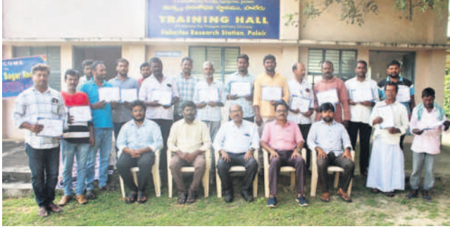
పాలేరు మత్స్య పరిశోధనా కేంద్రంలో శిక్షణ పుల్లి చేసుకున్న మత్స్యకారులు