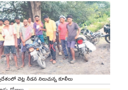
పని ప్రదేశంలో చెట్ల నీడన నిలుచున్న కూలీలు

దుర్భర జీవితాలు గడుపుతున్నారు. కేవోసీ వద్ద పొద్దుతా పని చేసినా పని ప్రదేశంలో నిలవ నీడతోపాటు కనీస సౌకర్యాలు లేకపోవడంతో వానా అవస్థలు పడుతున్నారు. ఏ కాలంలోనైనా చెట్ల నీడనే వచ్చుకుని పనులు చేసుకుంటున్న కూలీలకు కనీసం నీడ కల్పించాలనే ఆలోచన యాజమాన్యం చేయకపోవడంపై విమర్శలు వినిపిస్తున్నాయి. భూమి కోల్పోయిన నిర్వాసితులకు వనీట్రం పరిహారం ఇప్పి చేతులు దులుపుకుంటే తప్ప వారి బాగోగుల గురించి పట్టించుకున్న పాపం పోలేదు. కోయగూడెం పరిసర ప్రాంతాల్లో 22 ఏళ్ల క్రితం ప్రారంభమైన ఉపరితల గనిలో భూములు కోల్పోయిన నిర్వాసితులకు బోగ్గు రవాణాలో భాగంగా లారీలు, టిప్పర్లకు లోడ్లై బోగ్గు వెళ్లాలి జారించడం టార్గెట్ కట్టే కూలీలుగా పని చేసేందుకు సింగరేణి యాజమాన్యం అనుమతి ఇచ్చింది. దీంతో కేవోసీ-2లో లచ్చగూడెం, కిష్టారం, దారపాడు, లక్ష్మీపురం గ్రామాలకు చెందిన 240 మంది నిర్వాసితులు 4 గ్రామాలకు విడిపోయి పనులు చేస్తున్నారు. ఒక్కో గ్రామపుంజుకు 60 మంది చొప్పున 4 రోజులు నాలుగు మాత్రం కోయగూడెం ఉపరితల గని-2(కేవోసీ)లో టార్గెట్ కట్టే కూలీలుగా పనిచేస్తూ