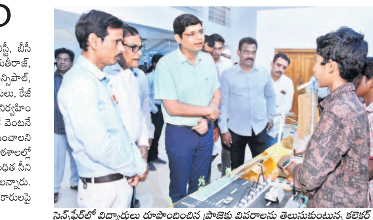
సైన్స్ ఫేరీలో విద్యార్థులు రూపొందించిన ప్రాజెక్టుల వివరాలను తెలుసుకుంటున్న కలెక్టర్

అన్ని ఆడిటోరియంలో నిర్వహించిన జిల్లా స్టాయి యుజిసోత్సవాలలో పాల్గొన్నారు. వివిధ పాఠశాలల విద్యార్థులు ఏర్పాటు చేసిన సైన్స్ ఫేరీను తిలకించారు. అక్టోబర్ 7లోగా పనులు పూర్తి చేయాలని, నివేదికలు సమర్పించాలని ఆదేశించారు. అనంతరం కలెక్టర్ స్థానిక కళాశాల