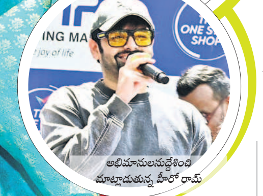
అభిమానులను దైవించి మాట్లాడుతున్న హీరో రామ్