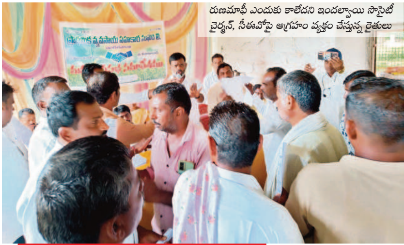
రుణమాఫీ ఎందుకు కాలేదని ఇంద్రప్రస్థం సోసైటీ వైద్యం, సీకావోపై అగ్రహారం వ్యవస్థ చేస్తున్న రైతులు