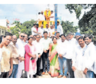
కామారెడ్డిలో కొండా లక్ష్మణ్ బాపూజీ విగ్రహానికి పూలమాల వేసి నివాళులర్పించిన కలెక్టర్

కామారెడ్డి/బాన్సువాడ/బాన్సువాడ రూరల్/ నల్లూబాద్/ ఎల్లారెడ్డి రూరల్/ బీర్పూర్/భిక్కనూరు, సెప్టెంబర్ 27 : జిల్లాలోని పలు మండలాల్లో కొండా లక్ష్మణ్ బాపూజీ జయంతిని శుక్రవారం నిర్వహించారు. ఈ సందర్భంగా ఆయన విగ్రహాలు, చిత్రపటాలకు పూలమాలలు వేసి నివాళులర్పించారు. జిల్లా కేంద్రంలోని కొత్త బస్స్టాండ్ సమీపంలో కొండా లక్ష్మణ్ బాపూజీ జయంతి నిర్వహించారు. ఈ సందర్భంగా పలువురు వక్కులు మాట్లాడుతూ.. తెలంగాణ ఉద్యమంలో తనవైన పాత్ర పోషించి క్రిల్డే ఇండియ పోరాటం, గైర్ ముఖ్య అంధోళన చేసిన స్వాతంత్ర్య సమరయోధుడని అన్నారు.