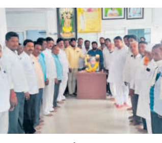
బాన్సువాడలో రాష్ట్ర వ్యవసాయ సలహాదారు పాఠశాల..