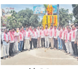
కామారెడ్డిలో బీఆర్ఎస్ నాయకులు, ప్రజాప్రతినిధులు