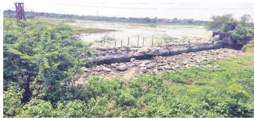
బాంబులతో పేర్లవేసిన శనిగకుంట చెరువు మత్తడి (ఫైల్)