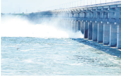
ప్రాంతానికి పోటెత్తుతున్న వరద

హజారుల, సెప్టెంబర్ 27 : మంచిర్యాల వరదలకు ఎల్లంపల్లి ప్రాంతానికి భారీగా వరద వచ్చి చేరుతున్నది. ప్రాంతాన్ని పూర్తి సామర్థ్యం 148 మీటర్లు కాగా, ప్రస్తుతం 147.99 మీటర్ల వరకు నీరు ఉంది. 20.175 టీఎంసీలకు గాను ప్రస్తుతం 19.7586 టీఎంసీల నీటి మట్టం ఉంది. 1.47,358 క్యూసెక్కుల ఇన్ఫ్లో ఉండగా, శుక్రవారం 16 గేట్లు ఎత్తి 1.82,502 క్యూ సెక్కుల నీటిని దిగువకు వదులుతున్నారు