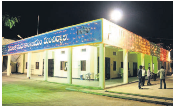
మంచిర్యాల మున్సిపల్ కార్యాలయం

మంచిర్యాలలో, సెప్టెంబర్ 27: విద్యుత్ ఉద్యోగుల బదిలీలకు ఉన్నతాధికారులు పచ్చజెండా ఉపయోగించారు. ఈ మేరకు శుక్రవారం టీజీ ఎన్ఎస్ఐసీఎల్ సీఎండ్ కెఆర్ బి వరదల గురించి ఉత్తర్వులు వెలువరించారు. 30-6-2024 నాటికి ఒకే ప్రాంతంలో రెండేళ్ల సర్వీసు పూర్తిచేసుకున్న వారు బదిలీకి దరఖాస్తు చేసుకునే వీలుంది. ఆయా సర్కిళ్ల పరిధిలో బదిలీలు నిర్వహించనున్నారు. ప్రత్యేక పరిస్థితుల్లో మాత్రమే వేరే సర్కిల్ కు బదిలీ చేసే అవకాశమున్నది. ఆపరేషన్ అండ్ మెయింటెనెన్స్ సిబ్బంది, ట్రైనింగ్ ఉద్యోగులకు మ్యానువల్ పద్ధతిలో బదిలీకి దరఖాస్తు చేసుకోవాలి అంటుంది. ఏకాంటు, ఏడీఈ, డీఈ, డీఈఎస్ ఉద్యోగులకు మాత్రమే అప్లై డాగ్గా బదిలీకి దరఖాస్తు చేసుకోవాలి. ఈ నెల 28 నుంచి 30వ తేదీ వరకు బదిలీలపై ఏమైనా అభ్యంతరాలుంటే తెలియపరచాలి అంటుంది. అక్టోబర్ 1 నుంచి 4వ తేదీ వరకు ఎంపిఎస్ఎస్ పోర్టల్లో అప్లై చేసే పాపం వరకు ఉంటుంది. అక్టోబర్ 7వ బదిలీ ఉత్తర్వులు అందజేస్తారు. 10వ బదిలీ అయిన ఉద్యోగులు వారికి కేటాయించిన స్థానాల్లో విద్యుత్ పోస్టులు ఉంటాయి. కాగా, బదిలీలకు సంబంధించిన గైడ్లైన్స్ వెలువడిన నేపథ్యంలో విద్యుత్ ఉద్యోగులు హర్షం వ్యక్తం చేస్తున్నారు.