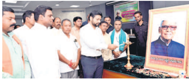
ఆసిఫాబాద్ లో అచార్య కొండా లక్ష్మణ్ బాపూజీ జయంతి వేడుకల్లో పాల్గొన్న కలెక్టర్, ఎమ్మెల్యే