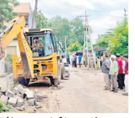
మందమర్రెడ్డి డ్రైనేజీలపై అక్రమణలను తొలగిస్తున్న మున్సిపల్ సిబ్బంది