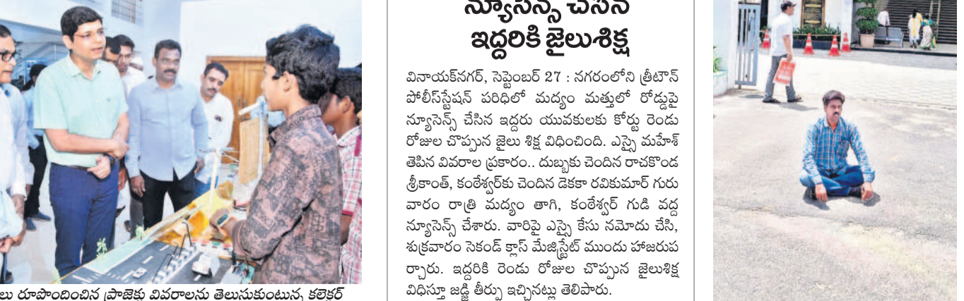
స్ట్రెక్చర్ లో విద్యార్థులు రూపొందించిన ప్రాజెక్టు వివరాలను తెలుసుకుంటున్న కలెక్టర్

అన్నారు. కలెక్టర్ బోర్డు ఎస్సీ, ఎస్టీ, బీసీ సంక్షేమ అధికారులు, పంచాయతీ రాజ్, కడప జ్యూడిషియల్ సంబంధిత ప్రెసిడెంట్, వసతి గృహాలు, సంక్షేమ అధికారులు, కేజీ బీసీ ప్రెసిడెంట్ సమావేశం నిర్వహించారు. తాగునీరు సమస్య ఉంటే వెంటనే పరిష్కరించే దిశగా ప్రతిపాదించాలని సూచించారు. వసతి గృహాలు, పాతకాలలో సమస్యలు ఉంటే వెంటనే సంబంధిత సీనియర్ అధికారికి వివరించాలన్నారు. పనుల్లో నిర్లక్ష్యం వహించిన అధికారులపై చర్యలు తీసుకుంటామన్నారు.