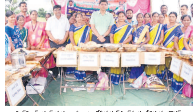
సెల్ఫ్ హెల్ప్ గ్రూప్ సభ్యులు ఏర్పాటు చేసిన ఫుడ్ డ్రైవ్ పరిచిస్తున్న కలెక్టర్