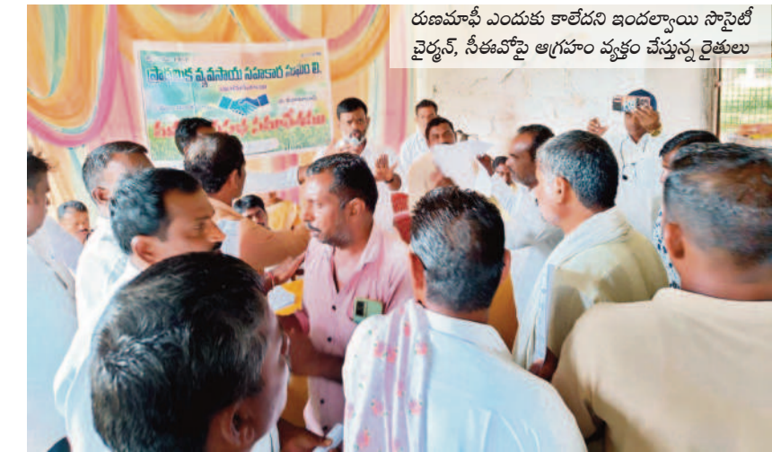
రణమాఫీ ఎందుకు కాలేదని ఇంద్రప్రస్థం సోసిటీ వైరల్, సీఈవోపై ఆగ్రహం వ్యక్తం చేస్తున్న రైతులు