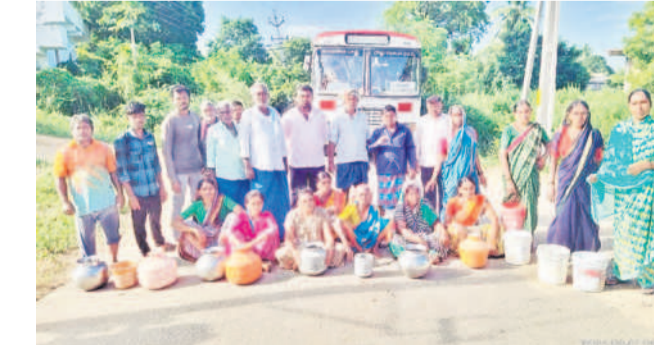
కోటగిరి, సెప్టెంబర్ 27: తాగునీటి కోసం మహిళలు రోడ్డు క్యాంపు. నీటి సమస్యను వెంటనే పరిష్కరించాలని డిమాండ్ చేస్తూ కోటగిరి మండలంలోని ఎక్సాస్ పూర్ క్యాంపులోని ఎస్సీ కాలనీల వారు శుక్రవారం ఉదయం ఖాళీ బిందెలతో రోడ్డుపై ఛాయించి, ధర్నా నిర్వహించారు. తాగునీటి సమస్య తీవ్రంగా ఉన్నా పట్టించుకోవరకే కరువయ్యాంటు అనేవది వ్యక్తంచేశారు. కాలనీలోని బోయిస్ పాటలు కాలిపోయిందని సంబంధిత శాఖ అధికారులకు పలుమాట్లు విన్నవించినా పట్టించుకోవడం లేదని మండిపడ్డారు. నీళ్ల కోసం వ్యవసాయ బోయిస్ పాటలు వద్దకు పరుగులు పెట్టాల్సి వస్తుందన్నారు. ఇప్పటికైనా అధికారులు స్పందించి నీటి సమస్య పరిష్కరించాలని డిమాండ్ చేశారు.