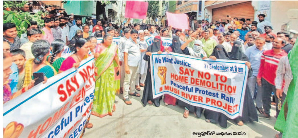
అత్తాపూర్ లో బాధితుల నిరసన