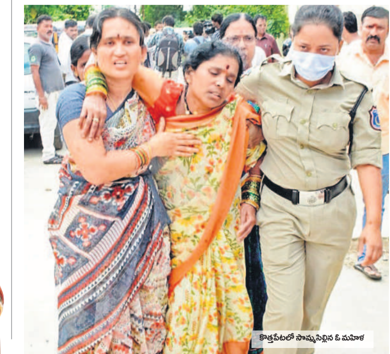
కొత్తపేటలో సామూహిక పోరాట