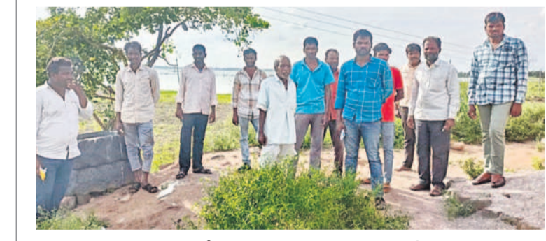
భయం గుప్పిట్లో బిక్కు.. బిక్కుమంటూ గడుపుతున్న కాలనీవాసులు

దసరా తర్వాత కూల్చివేతలుంటాయా ? నగరానికి పరిమితమైన హైద్రా మొట్టమొదటిసారిగా ఇబ్రహీంపట్నం