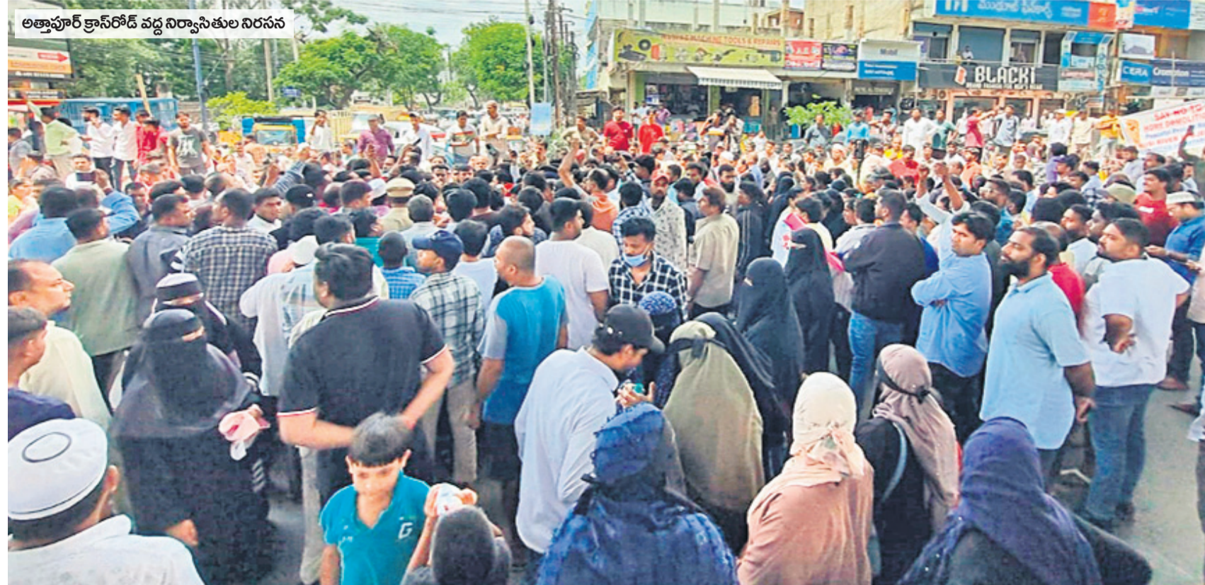
అత్తాపూర్ క్రాస్రోడ్ వద్ద నిర్వాసితుల నిరసన