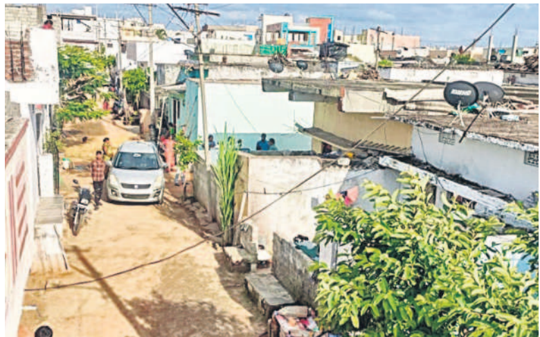
ఇబ్రహీంపట్నంలోని ఇందిరమ్మ కాలనీ