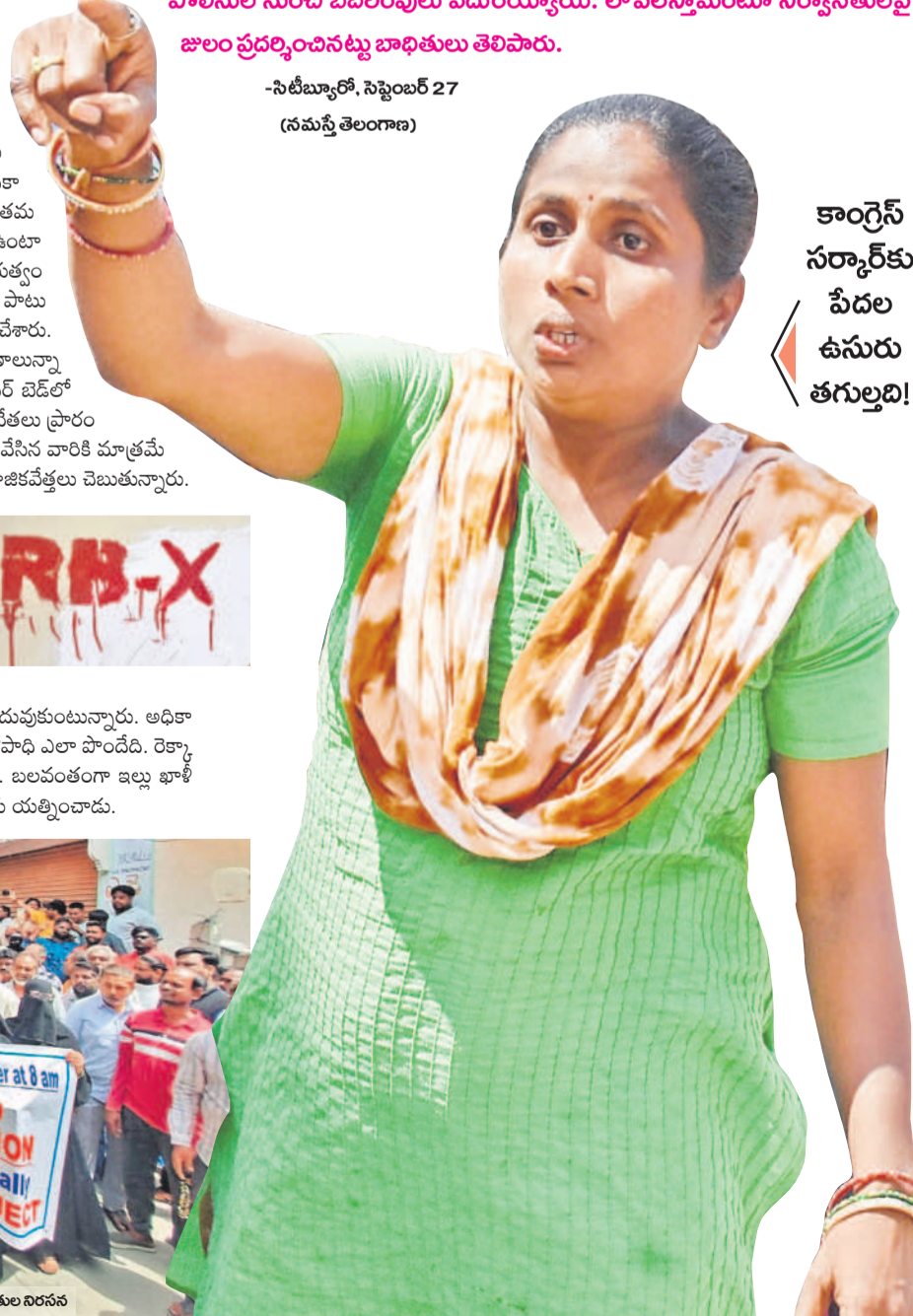
-సిటీబ్యూరో, సెప్టెంబర్ 27 (నమస్తే తెలంగాణ)

కాంగ్రెస్ సర్కార్ కు పేదల ఉసురు తగుల్చి!