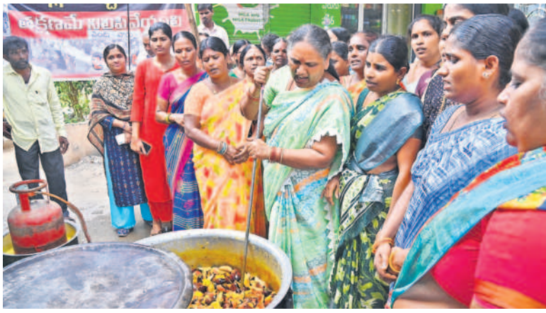
మూసీ పరివాహక ప్రాంతంలోని న్యూ మార్కెట్లో పంపావారుతో నిరసన తెలుపుతున్న నిర్వాసితులు