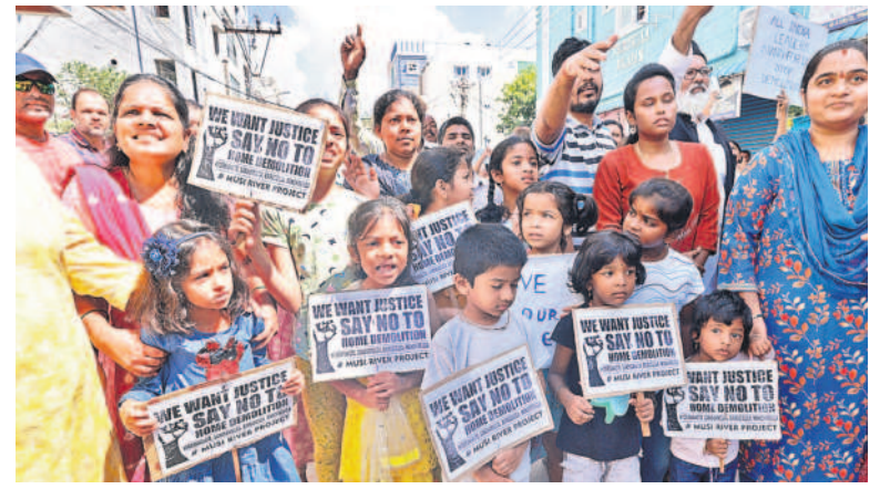
హైదరాబాద్లో మా ఇండ్లను కూల్చడంపై.. ప్రభుత్వానికి విజ్ఞప్తి చేస్తున్న చిన్నారులు