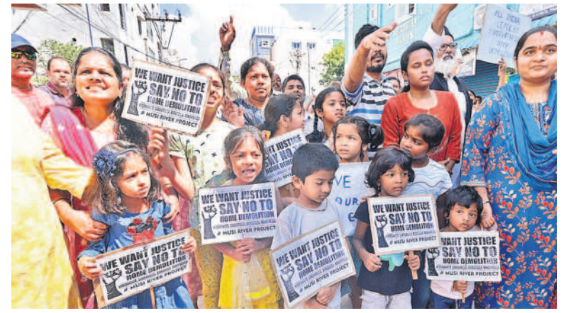
హైదరాబాద్లో మా ఇండ్లను కూల్చడంపై.. ప్రభుత్వానికి విజ్ఞప్తి చేస్తున్న చిన్నారులు