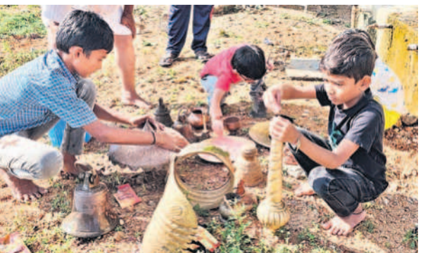
మిట్లు అంజనేయ సామి ఆలయ పరిసరాలను శుభ్రం చేస్తున్న సభ్యులు, మేము సైతం అంటూ సామగ్రిని కడుగుతున్న చిన్నారులు