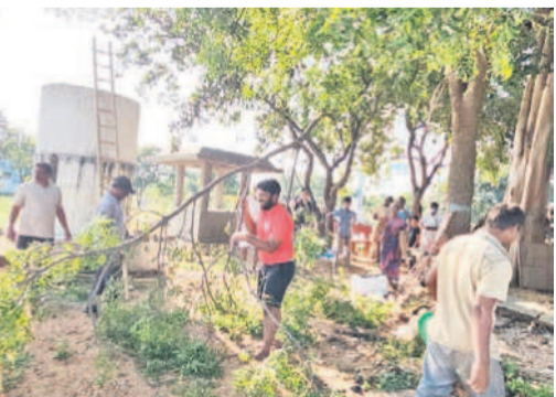
మిట్లు అంజనేయ సామి ఆలయ పరిసరాలను శుభ్రం చేస్తున్న సభ్యులు, మేము సైతం అంటూ సామగ్రిని కడుగుతున్న చిన్నారులు