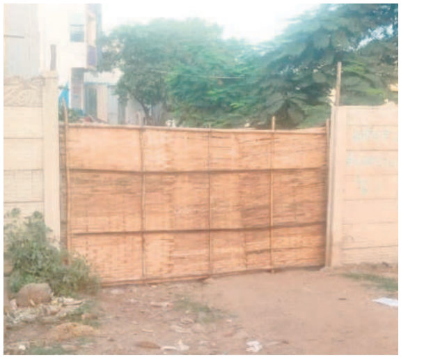
అధికారులు సీజ్ చేయడంతో మూతబడిన జమ్మిచేదు కల్లు దుకాణం

నుంచి 40 కేసుల కల్లును తయారు చేయవచ్చని ఇది సీపావ్ కొద్ది ఎక్కువగా మత్తు ఇస్తుండడంతో దీనిని వినియోగించి కల్లి కల్లు తయారు చేస్తున్నట్లు తెలుస్తోంది. ఇది ప్రమాదకరం అంటున్నారు. కల్లు తయారు చేసే అమాంస ప్రజల ప్రాణాలతో కల్లు తయారు చేయడం చెలాగటమే అంటున్నారు.