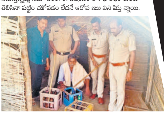
పోలీసుల దాడుల్లో పట్టుబడిన కల్లు (ఫైల్)