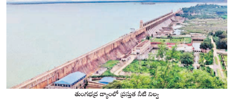
తుంగభద్ర డ్యాండ్లో ప్రస్తుత నీటి నిల్వ