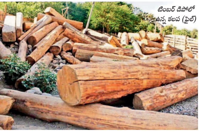
టింబర్ డిపోలో ఉన్న కలవ (ఫైల్)