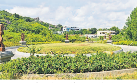
ఎండిపోయిన పార్కు, పడిపోయిన విగ్రహాల ముక్కలు

నిర్దేశ్యంలో 'సరిగమపదని' పార్కు అసాంఘిక కార్యకలాపాలకు నెలపు వట్టింతుకొని అధికార యంత్రాంగం హనుమకొండ, సెప్టెంబర్ 29 : సప్టర్వైలు మూగజోతున్నది. సంగీత ప్రయుక్త ఆహ్లాదాన్ని పంచాల్సిన పార్కు ఉనికిని కోల్పోతున్నది. అధికారుల నిర్దేశ్యంలో అసాంఘిక కార్యకలాపాలకు అడ్డాగా మారుతున్నది. చారిత్రక, పర్యాటక నేపథ్యం ఉన్న పద్మాక్షి ప్రాంతం తో అగ్లయ్యగట్ల, పద్మాక్షి, సిద్దేశ్వర తదితర చారిత్రక దేవాలయాలున్నాయి. ఇక్కడ రెండేళ్ల క్రితం రూ.కోటి నిధులతో సంగీత ప్రయుక్త కోసం నిర్మించిన ఈ పార్కులో దేశంలోని వివిధ రాష్ట్రాలు, ప్రాంతాలకు చెందిన సంగీత నృత్య భంగిమలను విగ్రహాలను ఏర్పాటు చేశారు. 'సరిగమపదని' పార్కులో మూగజోతున్నది.