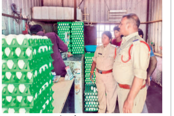
మట్ల పోలీసుల తనిఖీలు నిర్వహిస్తున్న తూరికల, కొలతల శాఖ అధికారులు

రేణుల క్రితం వరకు భానాపురం, బుద్దరావుపేట ఓడీసీఎంఎస్ కేవలం 9.99 బస్తలు చొప్పున, నెక్కోండ ఎఫ్ఎస్ఎస్ 11.97, పర్యవేక్షణ మండలం నల్లబిల్లి పీపీసీఎస్, వరంగల్ పీపీసీఎస్, ఓడీసీఎంఎస్, పర్యవేక్షణ ఏఆర్ఎస్ కేవలం 9.99 బస్తలు చొప్పున యూరియా సరఫరా జరిగింది. భానాపురం ఏఆర్ఎస్, గినుగొండ, విఘ్నానాధ పురం ఓడీసీఎంఎస్, మహ్యూపురం ఓడీసీఎంఎస్, నర్సంపేట ఏఆర్ఎస్-2, చింతలపల్లి పీపీసీఎస్ లలో అదే పరిస్థితి, సంఘాల్లో స్టాక్ లెక్కపోవడంతో మార్కెట్లో డీలర్ల వద్ద ఎక్కార్తే రూ. 287 అదనంగా డబ్బు చెల్లించి యూరియా కొనుగోలు చేయాల్సి వస్తుంది రైతులు తెలిపారు.