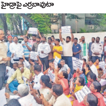
హైదరాబాద్ కలెక్టరేట్ వద్ద మూసీ బాధితులు నిర్వహించిన అందోళనలో పాల్గొన్న సీపీఎం నేతలు

కరీంనగర్ కార్యదేవున్, సెప్టెంబర్ 30: హైదరాబాద్ పేదలతో పేద, మధ్యతరగతి ప్రజల ఇండ్లను కూల్చివేస్తే ఊరుకోం ప్రశ్నలేదని కేంద్ర మంత్రి బండి సంజయ్ కుమార్ రాష్ట్ర ప్రభుత్వాన్ని హెచ్చరించారు. ఆవసరమైతే తమ ప్రాణాలను అడ్డు పెట్టి అయినా ప్రజల ఆస్థలను కాపాడతామని స్పష్టం చేశారు. సోమవారం కరీంనగర్ లో ఆయన మీడియాతో మాట్లాడారు. తమ ప్రాణాలను తీసిన తరువాతే హైదరాబాద్ పేదల ఇండ్లపైకి వెళ్లాలని సూచించారు. జీతాలకే పైనలేక అల్లాడుతుంటే మూసీ ప్రక్షాళన పేరుతో అప్పు తెచ్చి దోచుకునేందుకు కాంగ్రెస్ సిద్ధమైందని మర్యాదలు పూర్తి. హైదరాబాద్ తీరు చూస్తుంటే కాంగ్రెస్ ప్రభుత్వం కొరివితో తలగొక్కుండున్నట్లు ఉన్నదని అన్నారు.