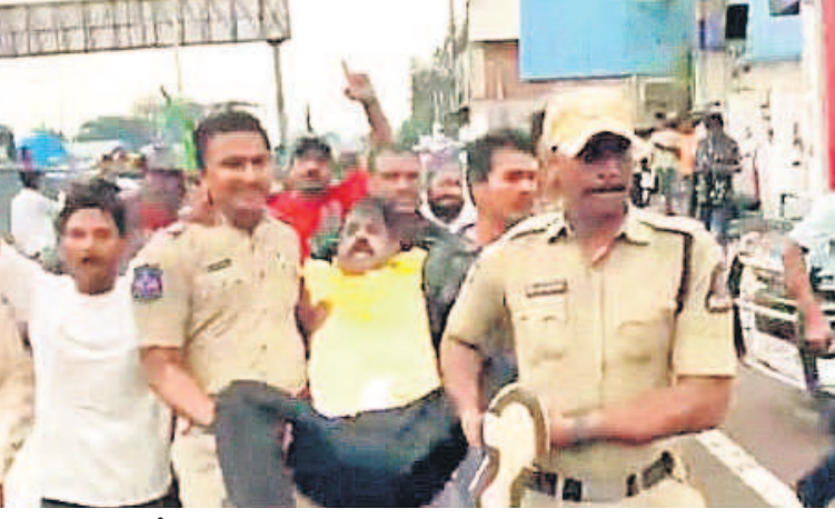
పాతబస్తీలో హైదరాబాద్ వ్యతిరేకంగా అందోళన చేస్తున్న వారిని అరెస్టు చేస్తున్న పోలీసులు

హైదరాబాద్ సిటీబ్యూరో, సెప్టెంబర్ 30 (నమస్తే తెలంగాణ): హైదరాబాద్లో రింగ్ రోడ్డు వరకు మాత్రం మనని, హైదరాబాద్ పేదల ఇండ్ల కోరిక పోదని, నివాసం ఉండే ఇండ్లను కూల్చేయడం హైదరాబాద్ కమిషనర్ పీ బి రంగనాథ్ తెలిపారు. సోమవారం ఆయన ఎక్స్ ప్రెస్ వేదికగా వరుసగా టీవీలు చేశారు. మూసీ నదికి ఇరువైపులా కొనసాగుతున్న సర్వేలతో హైదరాబాద్ సంబంధం లేదని పేర్కొన్నారు. నది పరివాహక ప్రాంతంలోని ఇండ్లపై హైదరాబాద్ మార్కెట్ చేయలేదని స్పష్టం చేశారు. మూసీ పరిధిలో నివసిస్తున్న వారిని హైదరాబాద్ తరలింపడం లేదని, నదిలో ఎలాంటి కూల్చివేతలు చేపట్టలేదని తెలిపారు. మూసీ సుందరీకరణను మూసీ రివర్ ప్రంట్ డెవలప్ మెంట్ కార్యోపేక్ష చేపడుతున్నదని వివరించారు. ప్రకృతి వనరుల పరిరక్షణ, చెరువులు, కుంటలు, నాలాలను కాపాడటం, వర్షాలు, వరదల సమయంలో రవాణాలు, నివాస ప్రాంతాలు మునిగిపోకుండా చర్యలు తీసుకోవడం హైదరాబాద్ బాధ్యత అని తెలిపారు. కాగా ఇప్పటివరకు క్వారంటైన్ లో ఉన్న వారు కూడా ఎందుకు దూకుతూ వ్యవహరించారని నెటిజన్లు హైదరాబాద్ కమిషనర్ మండిపడుతున్నారు.