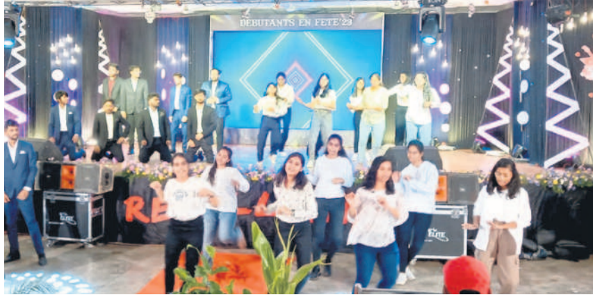
సాంస్కృతిక ప్రదర్శనలు ఇస్తున్న లిమ్మ వైద్య కళాశాల విద్యార్థులు