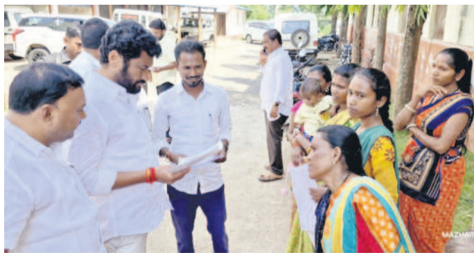
ఐటీడీఏ కార్యాలయం బయట నిలబడిన మహిళలతో మాట్లాడుతున్న ఎమ్మెల్యే అనిల్ జాదవ్

ఇక్కడ, ఒక యూనిట్ కు ఇద్దరు, ముగ్గురు కలిపి ఇవ్వాలని తెలిపారు. ఇటీవల హైదరాబాద్ లో జరిగిన ట్రిబ్యున్ మీటింగ్ లో కూడా పథకాలు కేవలం సబ్సిడీ వరకే కాకుండా బాగు పడాలనే ఉద్దేశంతో అమలు చేయాలని కోరడం జరిగిందన్నారు. గతంలో గిరిజనులు ఐటీడీఏకు వస్తే న్యాయం జరుగుతుందని వచ్చేవారని, ఇప్పుడు చెప్పాలి అగిలా తిరిగి న్యాయం జరగడం లేదని అవేదన వ్యక్తం చేశారు. అలాగే గిరిజనాసన పథకం రూ.2 లక్షలకు పెంచాలని కోరారు. ఐటీడీఏకు మళ్ళీ కళ పేరు గాల్గంటే ప్రభుత్వం బడ్జెట్ పెంచాలని కోరారు. ఈ కార్యక్రమంలో ఎమ్మెల్యే వెన్ను బొజ్జ ఉన్నారు.