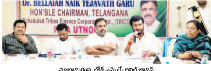
మాట్లాడుతున్న బోర్డ్ ఎమ్మెల్యే అనిల్ జాదవ్