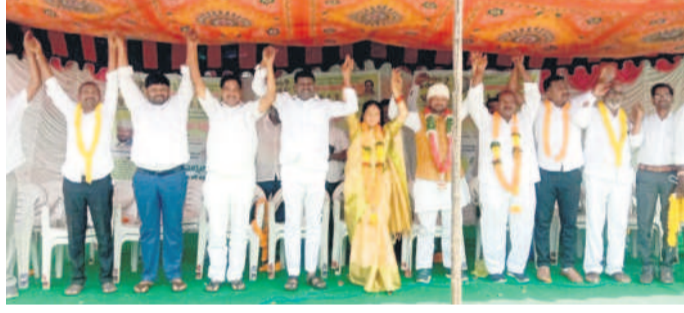
చేతులెత్తి ఐక్యత చాటుతున్న నాయకులు