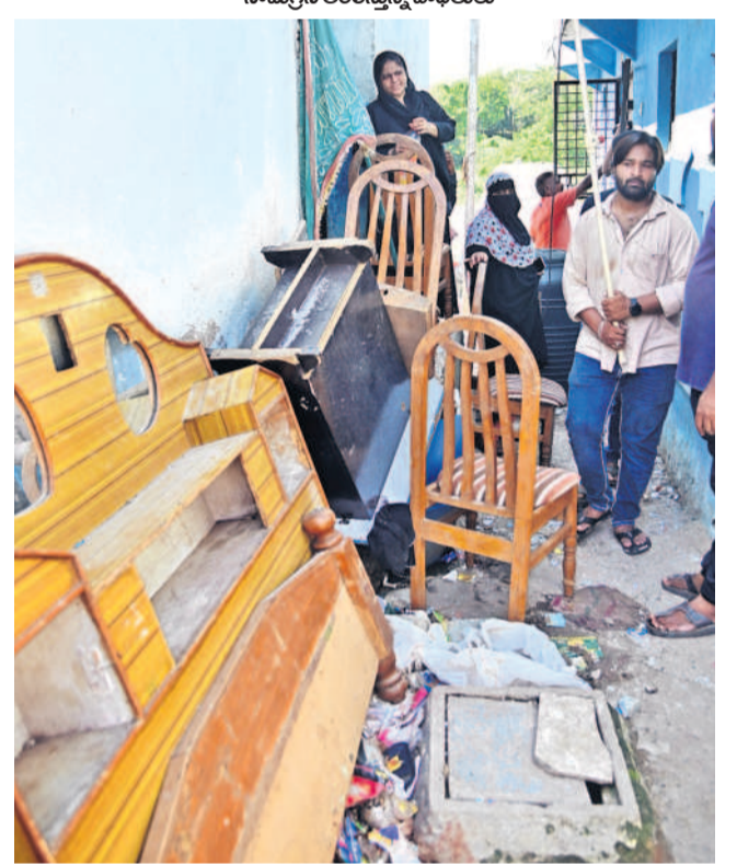
ఫలవన తరలిస్తున్న నిర్వాసితులు