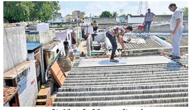
చాంద్రపూడిలోని శంకరనగర్లో ఇండ్లు కూల్చివేస్తున్న కూలీలు

హైదరాబాద్, బుధవారం 2 అక్టోబర్ 2024 HYDERABAD