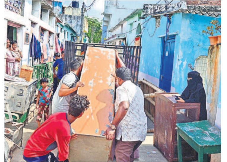
సామగ్రిని తరలిస్తున్న బాధితులు

కూల్చివేతలు చేయబోమంటూనే అధికారులు మూసీ పరివాహక ప్రాంతాల్లో నిర్వాసితుల ఇండ్లను మంగళ వారం కూల్చేశారు. సైదాబాద్లో ఉద్రిక్తతల మధ్య రెడ్ మార్చ్ చేసిన ఇండ్లను నేలమట్టం చేశారు. గల్లీలు చిన్నవి కావడంతో బుల్డోజర్లు, జేసీబీలు వెళ్లలేకపోవడంతో 50 మంది లేబర్లను రంగంలోకి దించారు. వాళ్లంతా సుత్తలు, గడ్డపాలలు తదితర సామగ్రిని ఉపయోగించి గోడలు, కప్పలను భూస్థాపితం చేశారు.