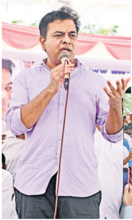
అంబర్పేటలో ఏర్పాటు చేసిన బీఆర్ఎస్ భరోసా సమావేశంలో మాట్లాడుతున్న బీఆర్ఎస్ పార్టీ వర్కింగ్ ప్రొసెడర్ కేటీఆర్