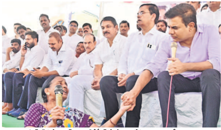
బీఆర్ఎస్ పార్టీ వర్కింగ్ ప్రొసెడర్ కేటీఆర్తో గొడు వెళ్లజోసుకుంటున్న మూసీ బాధితురాలు