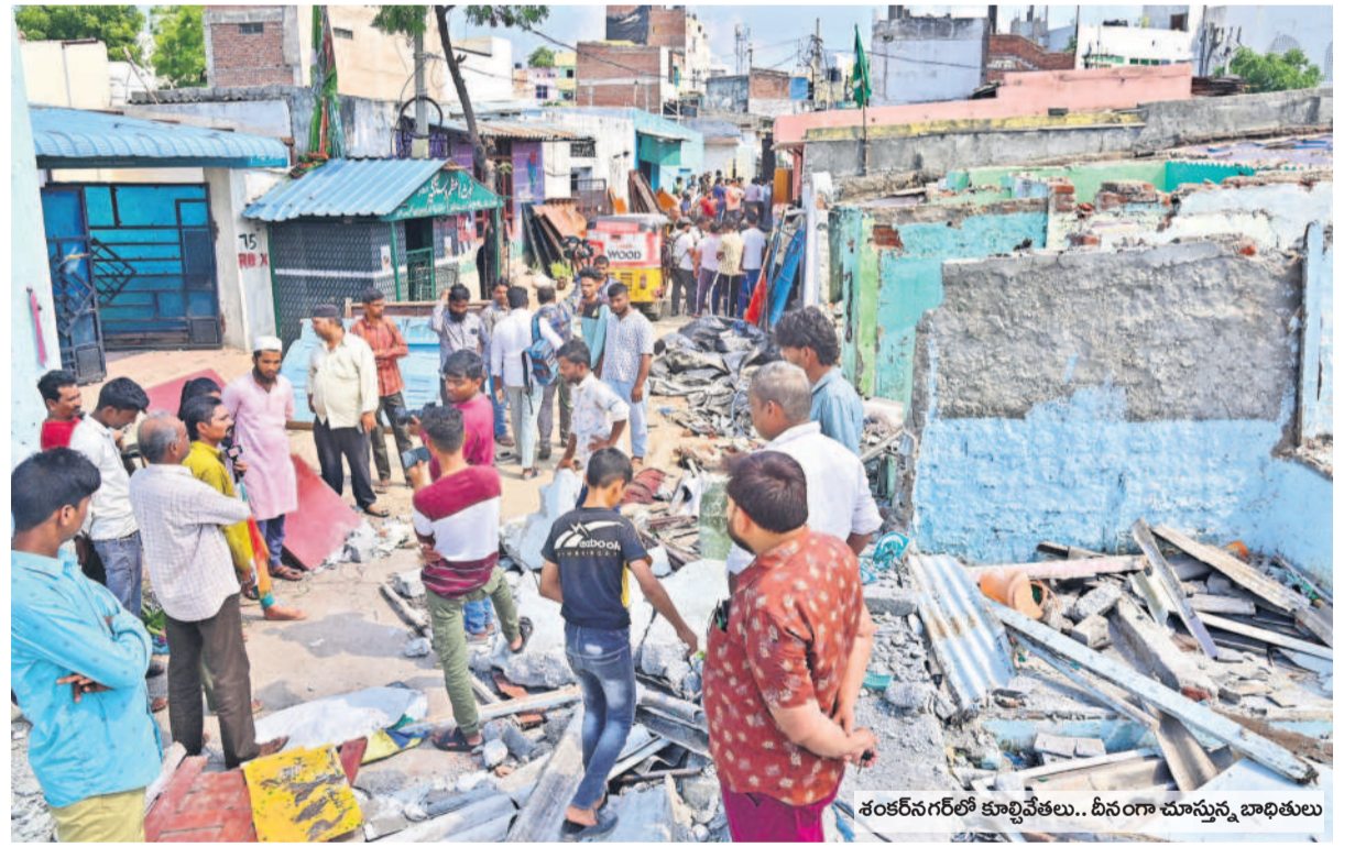
శంకరనగర్లో కూల్చివేతలు.. దీనంగా చూస్తున్న బాధితులు