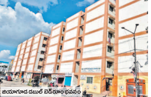
జియోగూడ డబుల్ బెడ్రూం భవనం

జిల్లాలో ఇప్పటి వరకు 163 డబుల్ ఇండ్లు కేటాయింపు వసతులు ఏర్పాటు చేయకుండానే ఇండ్లలోకి తరుముతున్న అధికారులు నిర్వాసితుల ఆగ్రహం