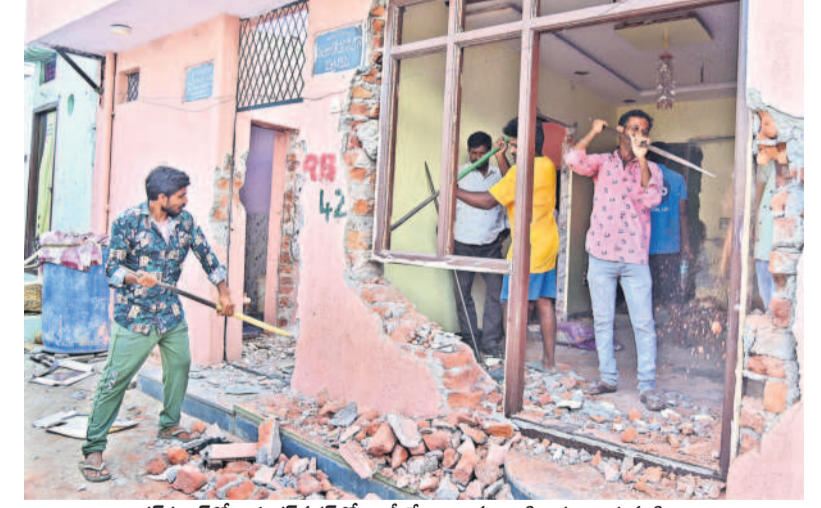
వాదరహాట్ లోని శంకర్ నగర్ లో ఖాళీ చేయించిన ఇంటిని కూల్చుతున్న నిపుంబి

హైదరాబాద్ సీటీబ్యూలో/మలకేపేట్, అక్టోబర్ 1 (నమస్తే తెలంగాణ): మూసీ నిర్మాణాలకు రోడ్ల సీఎం రేవంత్ రెడ్డి రాతి గుండెను కదిలించలేకపోయింది. అనుకున్నట్లుగానే మూసీ నిర్మాణాలకు వివాదాలను కలిపించి వారి బతుకులను చీకట్లో నెట్టేసి కుట్రకు శ్రీకారం చుట్టింది. అందులో భాగంగా హైదరాబాద్ లో మూసీ పరివాహక ప్రాంతాల్లో రెడ్ మార్క్ చేసిన ఇండ్లను మంగళవారం కూల్చేశారు. అడగడగునా బాధితులు అడ్డుకునే ప్రయత్నం చేసినా పోలీసుల హతాశం ఇండ్లను భూస్వామిక చేశారు. హైదరాబాద్ మండలం మూసీ పరివాహక ప్రాంతంలో 150 ఇండ్లను అధికారులు నేలమట్టం చేశారు. కూల్చవేతలు ఇప్పటికీ లేనట్టిన సర్కారు నొక్కులు నొక్కినా అధికారులు అందుకు విరుద్ధంగా మూసీలో కూల్చవేతలు ప్రారంభించి నిర్మాణాల్లో భయాందోళనలు నింపారు. మళ్లీ ఆ ప్రాంతంలో ఉద్రిక్త వాతావరణాన్ని సృష్టించారు. క్షణక్షణం తమ ఇండ్లను ఎక్కడ కూల్చవేస్తారోనని మిగిలిన నిర్మాణాలకు కంటి మీద కుసుకు లేకుండా గడుపుతున్నారు. ఇప్పటి వరకు అధికారులు 1,595 నిర్మాణాలను రివర్స్ ఇంట్లో గుర్తించారు. ఇందులో 940 ఇండ్లకు ఎక్కడ కూల్చవేస్తారోనని మిగిలిన నిర్మాణాలకు పాల్ తెలిపారు. కాగా, మంగళవారం 150 ఇండ్లను మలకేపేట్ ఎమ్మెల్యే సమకంఠో కూల్చవేస్తున్నట్లు అధికారులు తెలిపారు.