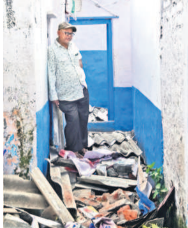
వాదరహాట్ ప్రాంతంలోని శంకర్ నగర్ లో అధికారులు కూల్చిన ఇంట్లో బాధితుడు