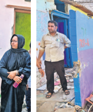
హైదరాబాద్ మండలం వాదరహాట్ లోని శంకర్ నగర్ లో ఖాళీ చేయించిన ఇండ్లను మంగళవారం కూల్చుతున్న నిపుంబి