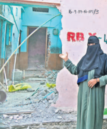
శంకర్ నగర్ లో మంగళవారం అధికారులు కూల్చేసిన తన ఇంటిని చూస్తూ ఆవేదన చెందుతున్న బాధితురాలు