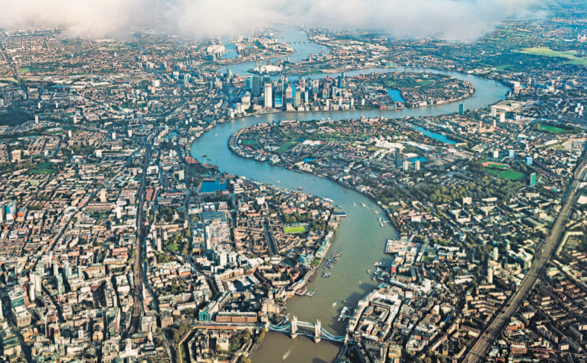
థేమ్స్ నది ఒడ్డున భారీ నిర్మాణాలు, వాణిజ్య సముదాయాలు