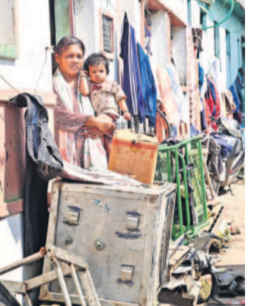
కూల్చవేత నేపథ్యంలో తన ఇంటి నుంచి భయంభయంగా చూస్తున్న మహిళ