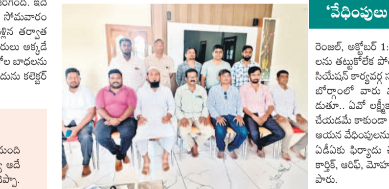
బోర్డంలో విలేజ్ లలో మాట్లాడుతున్న సీడ్స్, ప్లెస్టినైడ్ అసోసియేషన్ ప్రతినిధులు

ఈ నేపథ్యంలోనే రెంజిల్ కూడా తిరుగుబాటు ఎగిరవేశారు. దీనినంతటికీ ఓ కీలక అధికారి కారణమని సర్కూల్ డివిజన్ ఫిర్యాదు చేశారు. జిల్లా వ్యవసాయాధికారిపై తీవ్రమైన ఆరోపణలు చేస్తూ వ్యవసాయ శాఖ కమిషనర్ కు ఫిర్యాదు చేశారు. ఇందులో వ్యవసాయ శాఖలోని ఏవో వసూళ్ల పర్వంపై మంత్రి జాబ్బి సోమవారం పర్యటన ముగించుకుని వెళ్లిన తర్వాత పలువురు వ్యవసాయాధికారులు అక్కడే ఉన్న కలెక్టర్ కు కలిసి ఏకావోల బాధను చెప్పుకున్నారు. ఏవో ఫిర్యాదును కలెక్టర్ దృష్టికి తీసుకొచ్చారు.