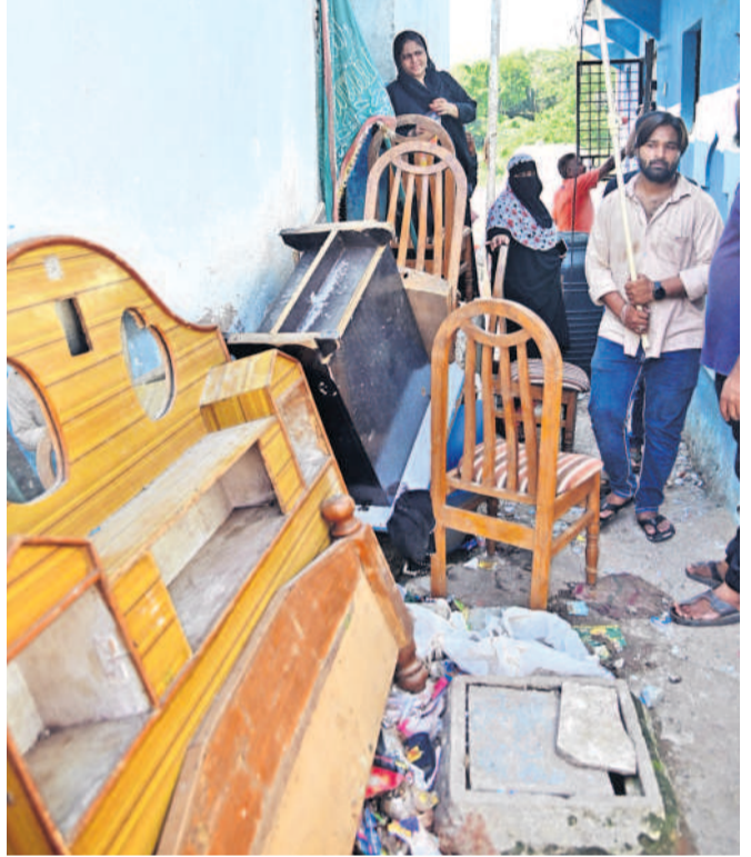
ఫలవర్షం తరలిస్తున్న నిర్వాసితులు

కూల్చివేతలు చేయబోమంటూనే అధికారులు ముసీ పరివాహక ప్రాంతాల్లో నిర్వాసితుల ఇండ్లను మంగళ వారం కూల్చేశారు. సైదాబాద్లో ఉద్రిక్తతల మధ్య రెడ్ మార్క్ చేసిన ఇండ్లను నేలమట్టం చేశారు. గల్లీలు చిన్నవి కావడంతో బుల్డోజర్లు, జేసీబీలు వెళ్లలేకపోవడంతో 50 మంది లేబర్లను రంగంలోకి దించారు. వాళ్లంతా సుత్తెలు, గడ్డపాలలు తదితర సామగ్రిని ఉపయోగించి గోడలు, కప్పలను భూస్థాపితం చేశారు.