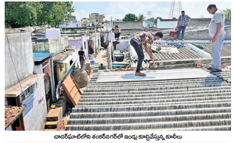
చాలావేగంతోని శరణగర్లో ఇండ్లు కట్టేస్తున్న కూలీలు