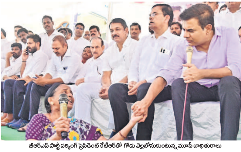
జిఆర్ఎస్ పార్టీ కార్యకర్తల సమీక్షలో కేటీఆర్ గారు ప్రసంగించిన సమయంలో ముసీ బాధితులను