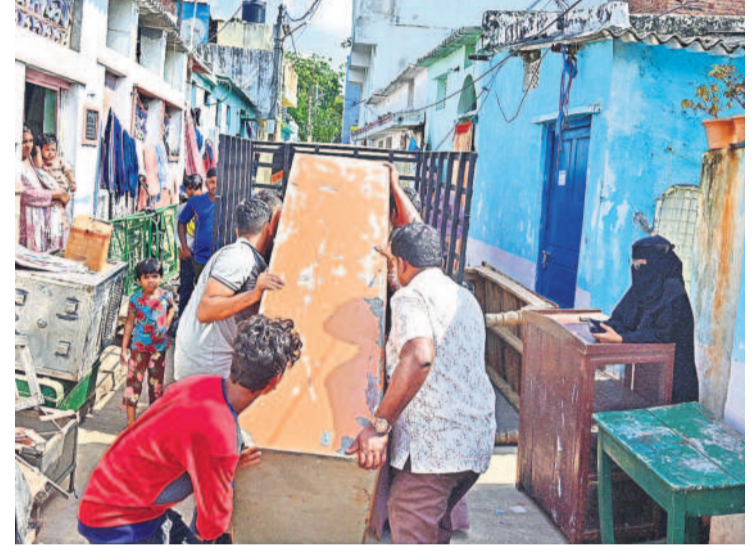
సామగ్రిని తరలిస్తున్న బాధితులు

కూల్చివేతలు చేయబోమంటూనే అధికారులు ముసీ పరివాహక ప్రాంతాల్లో నిర్వాసితుల ఇండ్లను మంగళ వారం కూల్చేశారు. సైదాబాద్లో ఉద్రిక్తతల మధ్య రెడ్ మార్క్ చేసిన ఇండ్లను నేలమట్టం చేశారు. గల్లీలు చిన్నవి కావడంతో బుల్డోజర్లు, జేసీబీలు వెళ్లలేకపోవడంతో 50 మంది లేబర్లను రంగంలోకి దించారు. వాళ్లంతా సుత్తెలు, గడ్డపాలలు తదితర సామగ్రిని ఉపయోగించి గోడలు, కప్పలను భూస్థాపితం చేశారు.