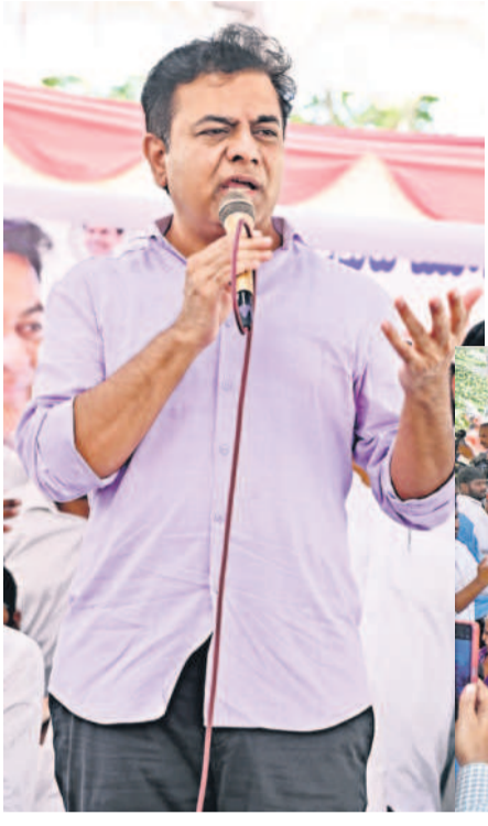
అంబర్పేటలో ఏర్పాటు చేసిన జిఆర్ఎస్ భరోసా సమావేశంలో మాట్లాడుతున్న జిఆర్ఎస్ పార్టీ వర్కర్ల సమీక్షలో కేటీఆర్