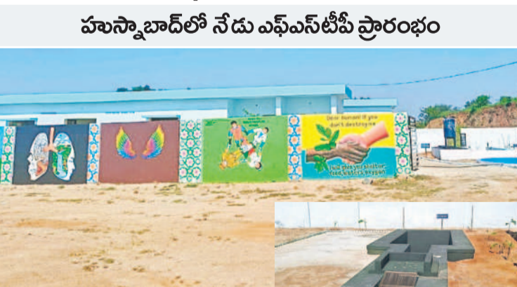
హుస్సేన్ బాద్ లోని ఎల్లవైచెరువు సమీపంలో ప్రారంభానికి సిద్దమైన ఎఫ్ఎస్టీపీ (ఇన్సెల్లో) మలాన్ని శుద్ధిచేసే నీరుగా మార్చే పోలిషింగ్ ప్లాంట్

హుస్సేన్ బాద్ టౌన్, అక్టోబర్ 1: ఆంధ్రరా ఆరోగ్యంగా ఉండాలనే లక్ష్యంతో పర్యావరణానికి మేలు చేసేందుకు కేసీఆర్ ప్రభుత్వం తీసుకున్న నిర్ణయంతో హుస్సేన్ బాద్ మానవ మల వ్యర్థాలతో ఎరువు తయారీ కేంద్రం నిర్మాణం పూర్తయింది. టీసీ సంక్షేమం, రవాణా శాఖ మంత్రి పొన్నం ప్రభాకర్ గౌడ్ బుద్ధవారం ప్రారంభించారు. బహిరంగ ప్రదేశాల్లో మానవ మలాన్ని పడేయడంతో ఎరువుతయ్యే సమస్యలను దూరం చేయాలని టీఆర్ఎస్ ప్రభుత్వం తీసుకున్న నిర్ణయంతో మానవ మల వ్యర్థాల శుద్ధి బుద్ధవారం సుందరి హుస్సేన్ బాద్ పట్టణంలో మొదలు కానున్నది. హుస్సేన్ బాద్ శివారులో ఫీట్ స్ట్రక్ ట్రీట్ మెంట్ ప్లాంట్ (ఎఫ్ఎస్టీపీ)ను నిర్మించేందుకు టీఆర్ఎస్ అధికారంలోకి వచ్చినప్పటినుంచి 1.10 కోట్లను టీఆర్ఎస్ ప్రభుత్వం మంజూరు చేసింది. ఎల్లవైచెరువు సమీపంలో ఎకరా స్థలంలో ఈ ప్లాంట్ నిర్మాణం చేపట్టారు. ప్లాంట్లో ప్రచారీ, ఆక్సిడెన్ట్ గెడ్, శిక్షణ గెడ్, అనారబిక్ స్టెబిలైజేషన్ రియెక్టర్, స్ట్రక్ట్రెయింగ్ బెడ్స్, బ్యూటీఫింగ్ ట్యాంకు, ప్లాంట్ గ్రావెల్ ఫిల్టర్, పోలిషింగ్ ప్లాంట్, అనారబిక్ బ్యాంక్ రియెక్టర్ గాడ్ బుద్ధవారం ప్రారంభించారు. పట్టణంలో శాశ్వతంగా సేకరించిన పదివేల లీటర్ల మానవ వ్యర్థాలను వివిధ పద్ధతుల్లో శుద్ధిచేసి ఎరువుగా మార్చేందుకు ప్రభుత్వం తీసుకున్న నిర్ణయంపై ప్రజలు సద్దయోగం చేసుకోవాలని, మూడేండ్లకు ఒకసారి తప్పనిసరిగా సెప్టిక్ ట్యాంక్ ను నిర్మించేందుకు బాధ్ మున్సిపల్ ఏక పృథ్వీరాజు కారారు.