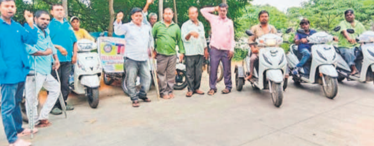
సిద్దిపేటలో నిరసన తెలుపుతున్న దివ్యాంగులు