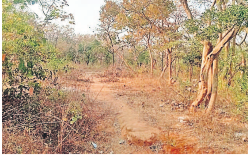
గుమ్మడిదల: డంపింగ్ యార్డు ఏర్పాటు చేయాలనుకుంటున్న నల్లవల్లి ఫ్యాక్టరీలోని అటవీ ప్రాంతం

గుమ్మడిదల, అక్టోబర్ 1: సంగారెడ్డి జిల్లా గుమ్మడిదల ప్రాంతంలో ఒకప్పుడు వానపడితే మట్టి వాసన వచ్చేది. ఇదంతా గతం. ఇప్పుడు ఈ ప్రాంతంలో సాధారణ పరిశ్రమలు ఏర్పాటు కావడంతో రసాయనాల వ్యర్థాల వాసనలు వస్తున్నాయి. దీంతో ప్రజలు జబ్బులు బారిన పడుతున్నారు. ఇది చాలదన్నట్లు ఇప్పటికీ వీరిపై మరో పిడుగుపడేందుకు రంగం సిద్ధమవుతున్నది. దీంతో గుమ్మడిదల మండల ప్రజలు ఆందోళన చెందుతున్నారు. వారి భయాలను, ఆందోళనను కారణం డంపింగ్ యార్డు హైదరాబాద్ మహానగరంలో పోగొట్టే చెత్తను గుమ్మడిదల మండలంలోనే నల్లవల్లి పంచాయతీ పరి