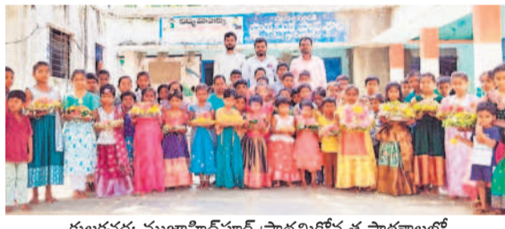
కులకచర్ల: ముజాహిద్పూర్ ప్రాథమికోన్నత పాఠశాలలో