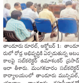
తాండూరు రూరల్, అక్టోబర్ 1: తాండూరులో రోడ్ల అభివృద్ధిపై పర్మిట్లు ఉన్న ఆంధ్రా సహకార నిర్వహించారు. ప్రధానంగా లైసెన్స్ రోడ్లపై సమీక్షించారు. అంతాం, వెంగోల్, రహుల్పూర్ గ్రామాల పరిధిలోని భూములతోపాటు పరిశోధన ఆర్ తీశారు. అదేవిధంగా పట్టణంలో రోడ్ల వెడల్పుపై కూడా మున్సిపల్ ఆఫీసరులను అడిగి తెలుసుకున్నారు. వీటిపై సమగ్ర వివరాలు అందించాలని ఆయా శాఖల అధికారులకు సబ్ కలెక్టర్ సూచించారు.