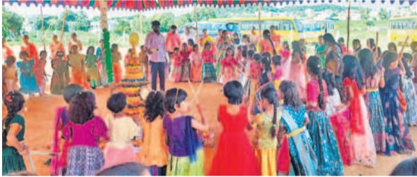
కులకచర్లలోని ఓ పాఠశాలలో..