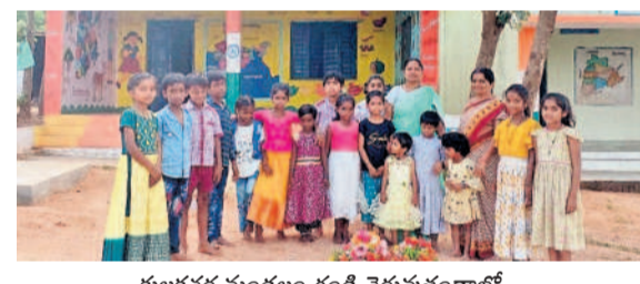
కులకచర్ల మండలం గండి చెరువుతండాలో..