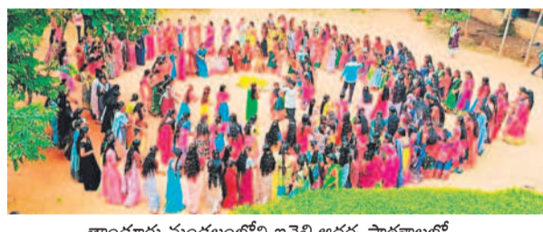
తాండూరు మండలంలోని ఇన్ఫెంట్ ఆదర్శ పాఠశాలలో..