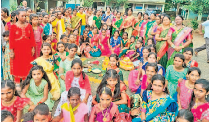
వికారాబాద్ పట్టణంలోని ప్రభుత్వ బాలికల ఉన్నత పాఠశాలలో..