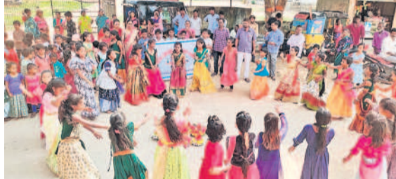
కులకచర్ల: ముజాహిద్పూర్ ప్రాథమికోన్నత పాఠశాలలో