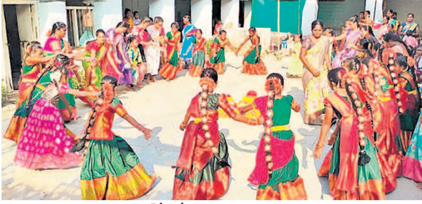
బోరాన్పేటలో బతుకమ్మ ఆడుతున్న బిచ్చారులు