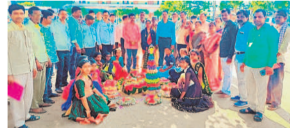
దోస్ ఉన్నత పాఠశాలలో..