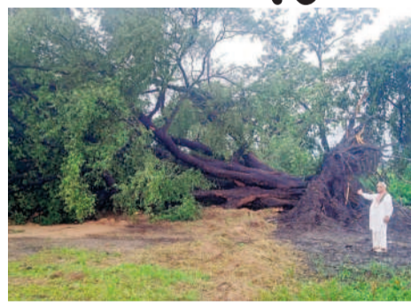
మంగపేటలోని శివాలయం సమీపంలో నేలకూలిన వందేళ్ల చింత చెట్టు

సమస్త తెలంగాణ నెటివర్క్ : ఉమ్మడి వరంగల్ జిల్లాలోని పలు మండలాల్లో బుధవారం సాయంత్రం గాలివాన బీభత్సం సృష్టించింది. ఉరుములు, మెరుపులతో పాటు వేగంగా వీచిన గాలులకు విద్యుత్ స్తంభాలు, చెట్లు విరిగిపడగా, పలుచోట్ల వరి తదితర పంటలు నేలకాలాయి. పలు గ్రామాలు విద్యుత్ లేక అంధకారంలో ఉన్నాయి. వరంగల్ నగరంలోని పలు ప్రాంతంలో వర్షం దంచికొట్టింది. భారీగా వీచిన గాలులకు వరంగల్ జిల్లా నల్లపల్లి మండలంలోని బోల్లోనిపల్లి నుంచి రంగారావు వైద్య ప్రధాన రహదారిపై చెట్టు కూలింది. జనగామ మండలంలోని సిద్దిపేట, పెంబర్ల గ్రామాల్లో స్తంభాలు నేలకాలడంతో విద్యుత్ సరఫరాకు అంతరాయం ఏర్పడింది. వరి, పత్తి, కురగాయల పంటలు దెబ్బతిన్నాయి. మండలంలోని చిన్న పెండ్యాల, నప్పల్, రాజవరం, పల్లగుట్టలో పాటు స్టేషన్లను పూర్తి మండలంలోని పలు గ్రామాల్లో వర్షం కురవడంతో పత్తి, మక్కజొన్న పంటలకు నష్టం వాటిల్లింది. అలాగే ములుగు జిల్లా కేంద్రంలో పాటు ములుగు మండలంలోని పలు