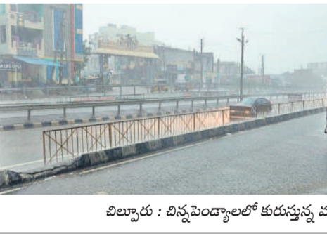
విల్వారు : చిన్నపెండ్యాలలో తుర్రున్న వర్షం

నేలకూలాయి. వెంకటాపూర్ మండలంలోని పాలపేట-వెంకటాపూర్ రహదారిలో చెట్టు కూడడంతో గంట పాటు రాకపోకలకు అంతరాయం ఏర్పడింది. హనుమకొండ జిల్లా శాయంపేట, అత్తకూరు మండలాల్లో పాటు మహబూబాబాద్ జిల్లా డోర్నకల్ మున్సిపాలిటీ పరిధిలోని బొక్కలకొట్టి పద్ద చెట్టు విరిగి 11 కేబి విద్యుత్ లైన్పై పడడంతో విద్యుత్ సరఫరాకు అంతరాయం ఏర్పడింది. అలాగే ముల్కలపల్లి పద్ద విద్యుత్ స్తంభాలు విరిగిపోయాయి. అలాగే నర్సంపాలపేట, నెల్లికూరు, దండాపల్లి, చిన్నగూడూరు మండలాల్లోని పలు గ్రామాల్లో సైతం భారీ వర్షం కురిసింది.