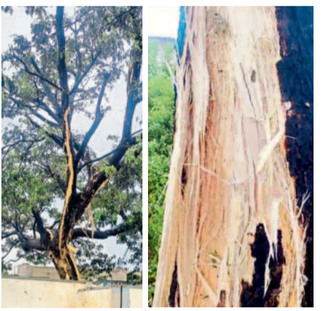
ములుగు రూల్లో : మల్లంపల్లి ప్రభుత్వ పాఠశాలలోని చెట్టుపై పీడుగు పడడంతో బీలికలు ఏర్పడిన దృశ్యం

నేలకూలాయి. వెంకటాపూర్ మండలంలోని పాలపేట-వెంకటాపూర్ రహదారిలో చెట్లు కూడడంతో గంట పాటు రాకపోకలకు అంతరాయం ఏర్పడింది. హనుమకొండ జిల్లా శాయంపేట, అత్తకూరు మండలాలతో పాటు మహబూబ్ నగర్ జిల్లా డోర్నకల్ మున్సిపాలిటీ పరిధిలోని బొక్కలకొట్ల వద్ద చెట్టు విరిగి 11 కేబి విద్యుత్ లైన్పై పడడంతో విద్యుత్ సరఫరాకు అంతరాయం ఏర్పడింది. అలాగే ముల్కలపల్లి వద్ద విద్యుత్ స్తంభాలు విరిగిపోయాయి. అలాగే నర్సంపాలపేట, నెల్లికూరు, దండాపల్లి, చిన్నగూడూరు మండలాల్లోని పలు గ్రామాల్లో సైతం భారీ వర్షం కురిసింది.