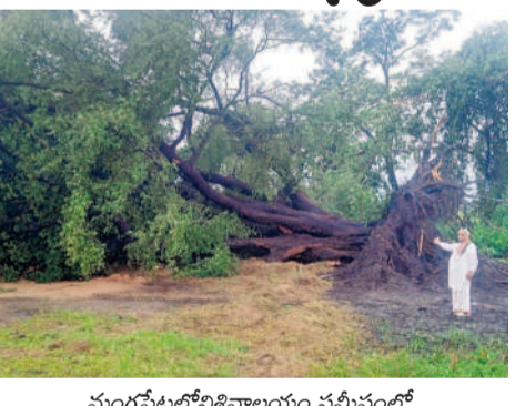
మంగపేటలోని శివాలయం సమీపంలో నేలకూలిన వందేళ్ల చింత చెట్టు

సమస్త తెలంగాణ నెట్వర్క్ : ఉమ్మడి వరంగల్ జిల్లాలోని పలు మండలాల్లో బుధవారం సాయంత్రం గాలివాన బీభత్సం సృష్టించింది. ఉరుములు, మెరుపులతో పాటు వేగంగా వీచిన గాలులకు విద్యుత్ స్తంభాలు, చెట్లు విరిగిపడగా, పలుచోట్ల వరి తదితర పంటలు నేలకొల్పాయి. పలు గ్రామాలు విద్యుత్ లేక అంధకారంలో ఉన్నాయి. వరంగల్ నగరంలోని పలు ప్రాంతంలో వర్షం దంచికొట్టింది. భారీగా వీచిన గాలులకు వరంగల్ జిల్లా నల్లపల్లి మండలంలోని బోల్లోనిపల్లి నుంచి రంగారం వైపు ప్రధాన రహదారిపై చెట్లు కూలింది. జనగామ మండలంలోని సిద్దింకి, పెంబర్ల గ్రామాల్లో స్తంభాలు నేలకొల్పడంతో విద్యుత్ సరఫరాకు అంతరాయం ఏర్పడింది. వరి, పత్తి, కురగాయల పంటలు దెబ్బతిన్నాయి. మండలంలోని చిన్న పెండ్యాల, నప్పల్, రాజవరం, పల్లనట్లతో పాటు మహబూబ్ నగర్ మండలంలోని పలు గ్రామాల్లో వర్షం కురవడంతో పత్తి, మక్కజొన్న పంటలకు నష్టం వాటిల్లింది. అలాగే ములుగు జిల్లా కేంద్రంలో పాటు ములుగు మండలంలోని పలు