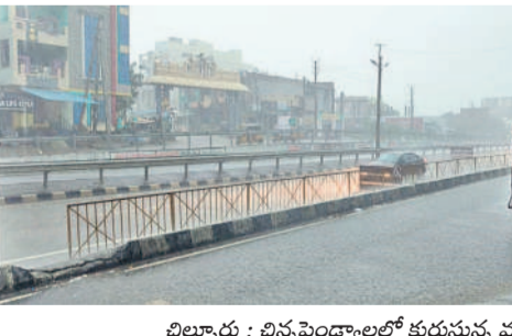
విల్వూరు : చిన్నపెండ్యాలలో తుర్రున్న వర్షం

నేలకూలాయి. వెంకటాపూర్ మండలంలోని పాలపేట-వెంకటాపూర్ రహదారిలో చెట్లు కూడడంతో గంట పాటు రాకపోకలకు అంతరాయం ఏర్పడింది. హనుమకొండ జిల్లా శాయంపేట, అత్తకూరు మండలాలతో పాటు మహబూబ్ నగర్ జిల్లా డోర్నకల్ మున్సిపాలిటీ పరిధిలోని బొక్కలకొట్ల వద్ద చెట్టు విరిగి 11 కేబి విద్యుత్ లైన్పై పడడంతో విద్యుత్ సరఫరాకు అంతరాయం ఏర్పడింది. అలాగే ముల్కలపల్లి వద్ద విద్యుత్ స్తంభాలు విరిగిపోయాయి. అలాగే నర్సంపాలపేట, నెల్లికూరు, దండాపల్లి, చిన్నగూడూరు మండలాల్లోని పలు గ్రామాల్లో సైతం భారీ వర్షం కురిసింది.