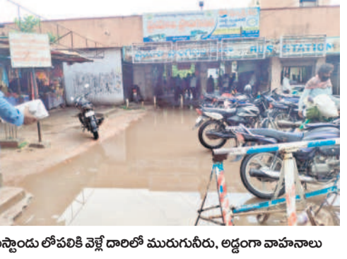
బస్టాండు లోపలికి వెళ్లే దారిలో మురుగునీరు, అడ్డంగా వాహనాలు

మంచిర్యాలటౌన్, ఆక్టోబర్ 2: మంచిర్యాల ఆర్టీసీ బస్టాండులోకి వెళ్లాలంటే ప్రయాణికులు అప్లైడ్ కార్డులు పడల్సి వస్తుంది. ఇరుకుగా ఉండే ద్వారం, దారికి అడ్డంగా దొంగ వాహనాలు, అటోల పార్కింగ్, పండ్లు, పూల దుకాణాలు మరో వైపు బుధవారం కురిసిన వాస్తవో బుధవారం మారడంతో ప్రయాణికులు తీవ్ర ఇబ్బందులు పడ్డారు. బస్టాండులోకి వెళ్లేందుకు ఇబ్బంది లేకుండా ఆర్టీసీ అధికారులు చర్యలు తీసుకోవాలని ప్రయాణికులు కోరుతున్నారు.