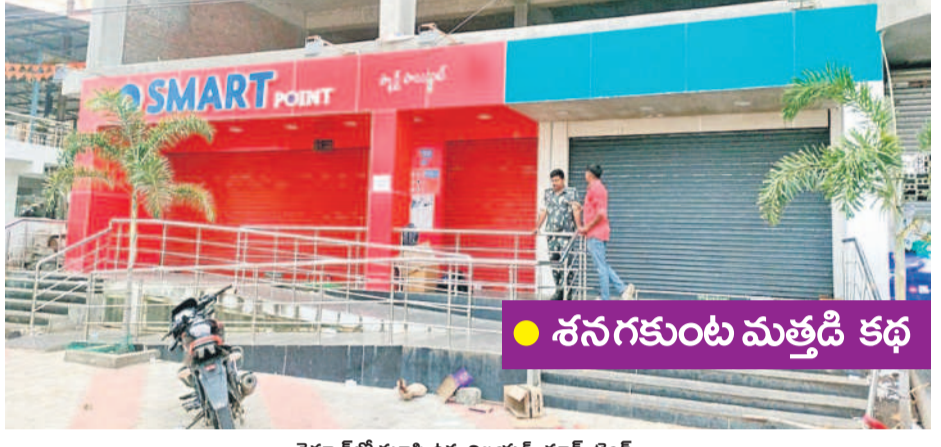
చెన్నూర్లో మూస ఉన్న రిలయన్స్ మార్కెట్, ట్రెండ్స్