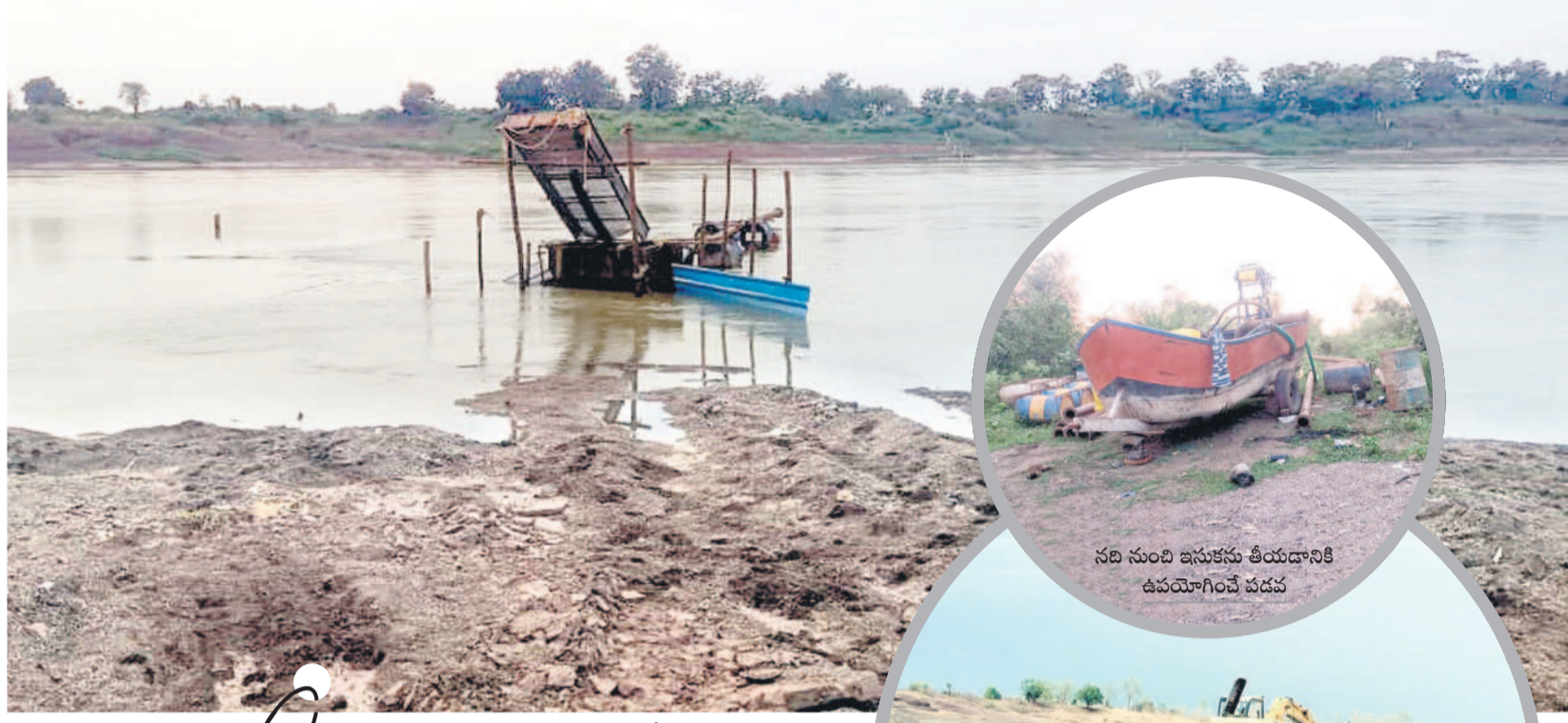
సది నుంచి ఇసుకను తీయడానికి ఉపయోగించే పద్ధతి

మామి బోసని నుంచి తప్పించుకునేందుకు ప్రభుత్వం క్యాలిఫర్ల వంటి సూక్ష్మ కొలతల పరికరాలను తెర మీదికి తెచ్చుతున్నట్లు విమర్శలు వినిపిస్తున్నాయి. గత యాసంగిలో బోసని ఇవ్వకుండా ఎగవేసిన కాంగ్రెస్ ప్రభుత్వం, ఈ వాసకాలంలోనైనా ఇస్తుందో లేదో అన్న అనుమానాలు వ్యక్తమవుతున్నాయి. అయితే ఇప్పటి వరకు బోసనిపై విధివిధానాలు ఖరారు కాకపోవడం గందరగోళానికి కారణమవుతున్నది. బోసనిపై ప్రభుత్వం నుంచి స్పష్టత రాకపోవడంతో రైతుల్లో అయోమయం నెలకొన్నది. ఈసారి జిల్లాలో 1.35 లక్ష ఎకరాల్లో వరి సాగు చేయగా.. 62,970 మెట్రిక్ టన్నుల సస్పరకం ధాన్యం దిగుబడులు వస్తాయని వ్యవసాయ శాఖ అధికారులు అంచనా వేశారు. ఒకవేళ ప్రభుత్వం బోసని ఇవ్వకపోతే మళ్లీ ధాన్యాలనే ఆశ్రయించాల్సి వస్తుంది. మరోసారి బోసని పేరిట రైతులను మోసం చేసేందుకు సిద్ధమవుతున్నట్లు చెబుతున్నారు.