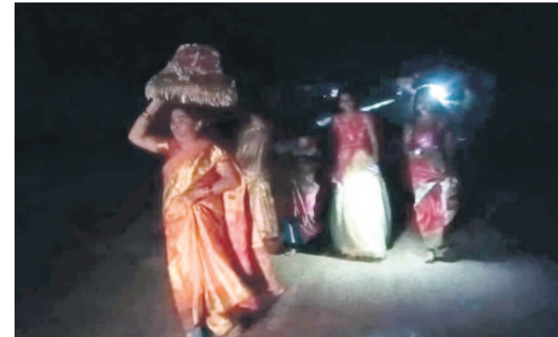
చీకట్లనే శోభాయాత్రగా సరస్వతీ అమ్మవారి కోనేరుకు వెళ్తున్న మహిళలు

బేల మండలం కాంగారపూర్ పెన్గంగా నది నుంచి మహారాష్ట్రకు భారీగా ఇసుక తరలుతున్నది. శంకర్ గూడ ముద్గా కొర్రానా, వణి ప్రాంతాలకు చేరవేస్తున్నారు. పడవల ద్వారా ఇసుక తీసి ఒక్కో టీవీల్లో రూ.24 వేలు తీసుకుంటున్నారు. మహారాష్ట్రలో ఒక్కో టీవీల్లో ఇసుక ధర రూ.60 వేల వరకు పలుకుతుండగా అక్రమార్కుల వ్యాపారం మూడు నడులు, ఆరు టీవీల్లో కొనుగోలు చేస్తున్నారు. ఒక్కో వాహనం రవాణా చేస్తే రూ.30 వేల వరకు మిగులుతాయని ప్రచారం ఉంది. ఇసుక అక్రమ రవాణాను అడ్డుకోవాలని ఇటీవల బేల మండలవారు తహసీల్దార్, పోలీసులకు వినతిపత్రాలు అందజేశారు. మండలంలో ఇసుక అక్రమ రవాణా జరగకుండా చర్యలు తీసుకోవాలని స్థానికులు కోరుతున్నారు. కాంగారపూర్ పెన్గంగా నుంచి అక్రమ రవాణా విషయంలో బేల తహసీల్దార్లను రఘునాథ్ రావును వివరాలు అడుగగా సదిలో ప్రస్తుతం నీళ్లు ఉన్నాయని ఎలాంటి తవ్వకాలు జరగడం లేదన్నారు.