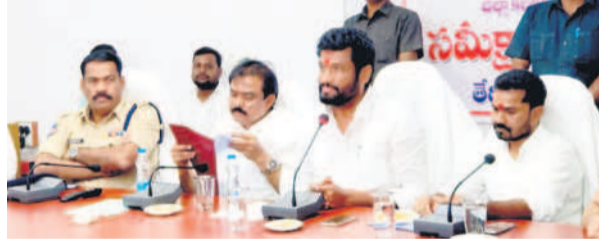
మాట్లాడుతున్న బోర్డ్ ఎమ్మెల్యే అనిల్ జాదవ్