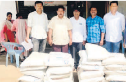
స్వాధీనం చేసుకున్న క్లోరల్ హైడ్రేట్, అల్కోహాల్