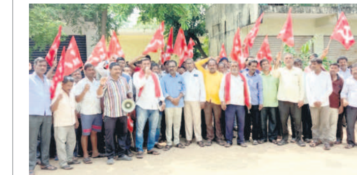
సిరిసిల్ల పట్టణంలోని వేవేత జోషిశాఖ కార్యాలయం ఎదుట ధర్నా చేస్తున్న నేతన్నలు