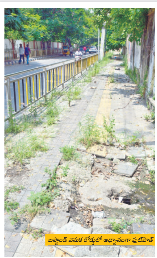
బస్టాండ్ వెనుక రోడ్డులో అధ్యానంగా పుట్టిపాత