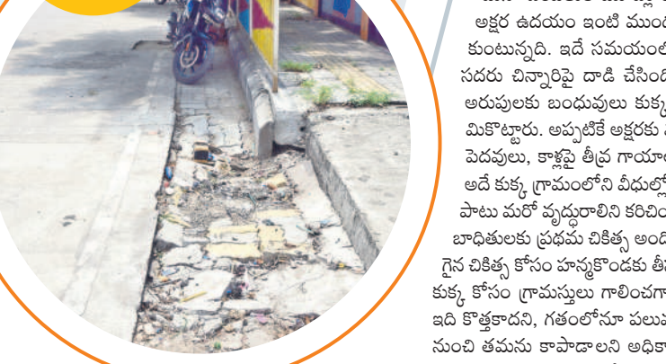
మహిళా డిగ్రీ కళాశాల సమీపంలోని పుట్టిపాత