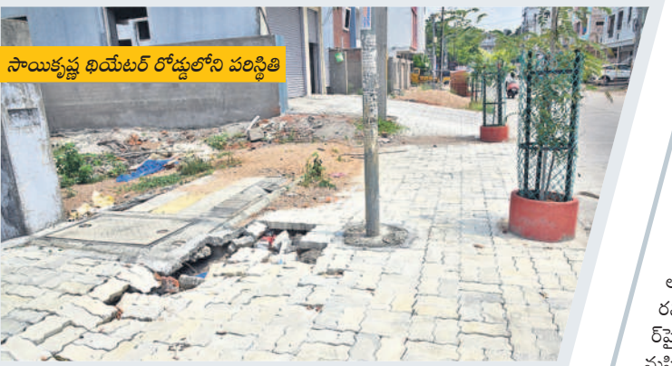
సాయికృష్ణ ఖయ్యల రోడ్డులోని పరిస్థితి

మరమ్మతుల కోసం అదేశాలు ఇచ్చాం నగరంలో పుట్టిపాతలు, మల్టీపర్ఫార్మింగ్ పార్కింగ్ స్థలాల్లో ఇబ్బందులు చూస్తున్న కుడా వచ్చాయి. వాటికి పూర్తిస్థాయిలో మరమ్మతులు చేయించాలని ఇప్పటికే కాంట్రాక్టర్లకు అదేశాలు ఇచ్చాం. స్టాన్డినీటీ రోడ్లన్నింటిలోనూ దెబ్బతిన్న వాటిని మరమ్మతులు బంధించుకు చర్యలు తీసుకుంటాం. పలు ప్రాంతాల్లో భారీ వాహనాలు రావడం, కొన్ని ప్రాంతాల్లో యజమానులు చేపట్టిన పనుల మూలంగా ట్రైల్స్ దెబ్బతిన్నాయి. వీటిని కూడా గుర్తించి చర్యలు తీసుకోవాలని ఇంజనీరింగ్ అధికారులకు సూచనలు చేశాం. - డా.పాతల్ బాబుసాహెబ్, నగరపాలకసంఘ కమిషనర్