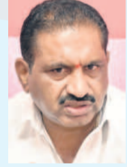
- దావాలి సురేకరావు, మేయర్ (కరీంనగర్)

రెండేళ్ల నిర్లక్ష్యం కాంట్రాక్టర్లదే స్టాన్డినీటీ కింద చేపట్టిన రోడ్లను మున్సిపాలిటీ తీసుకున్న తర్వాత రెండేళ్ల వరకు కాంట్రాక్టర్ నిర్లక్ష్యం చేయాలి. ఏయే రోడ్లు ఎప్పుడు తీసుకున్నామని ఇంజనీరింగ్ అధికారులు పరిశీలించి, వెడిపోయిన ప్రాంతాల్లో మరమ్మత్తులు చేయించాలి. కొన్ని ప్రాంతాల్లో యజమానుల వల్ల కూడా పుట్టిపాతలు దెబ్బతిన్నాయి. ఎక్కడ చెడిపోయినా దానికి బాధ్యులు ఎవరో గుర్తించి మళ్లీ మరమ్మత్తులు చేయించేలా ఇంజనీరింగ్ అధికారులు చర్యలు తీసుకోవాల్సి ఉంది. పూర్తిస్థాయిలో మరమ్మత్తులు చేయించాలని అధికారులకు సూచనలు చేశాం.