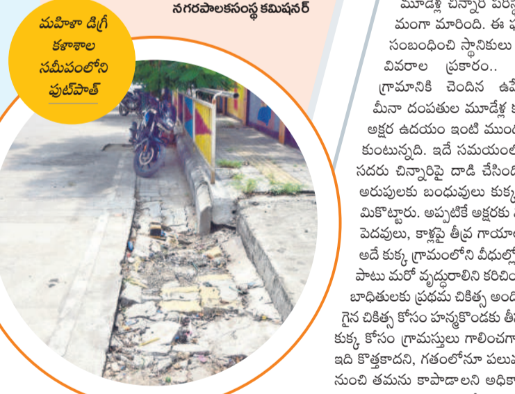
మహిళా డిగ్రీ కళాశాల సమీపంలోని పుట్టిపాత