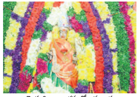
శైలపుత్రి అలంకారముతో అమ్మవారు