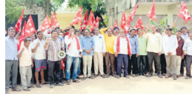
సిరిసిల్ల పట్టణంలోని వేనేట్ జోషి శాఖ కార్యాలయం ఎదుట ధర్నా చేస్తున్న నేతన్నలు