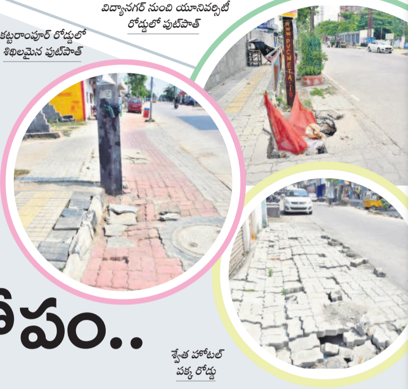
కట్టరాంపూర్ రోడ్డులో శిథిలమైన పుట్టిపాత

స్టాన్డినీటీ కరీంనగర్ కు కేంద్రంతోపాటు బీఆర్ఎస్ సర్కారు నిధుల వరద పాలించింది. వందల కోట్లతో అభివృద్ధి పనులు చేయించింది. అయితే కాంట్రాక్టర్ల కక్కుర్తి, అధికారుల పర్యవేక్షణ లోపం ప్రగతికి నిరోధంలా మారింది. పనుల్లో నాణ్యతాలోపంతో అధ్యానంగా మారాయి. రోడ్లు రెండేళ్లకే పగుళ్లు చూపుతున్నాయి. పుట్టిపాత, మట్టిపర్చిన పాలింగ్ ట్రైల్స్ పగిలిపోతున్నాయి. కొన్నిచోట్ల కుంగిపోయి నడవడానికి పీలు లేకుండా తయారయ్యాయి. పది కాలాలపాటు నిలువాల్సిన పనులు ఇంత తొందరగా మరమ్మత్తులకు చేరడంపై తీవ్ర విమర్శలు వెల్లువెత్తుతున్నాయి. ఇప్పటికైనా చేపట్టే పనులు నాణ్యతతో చేయాలని, ఆ మేరకు అధికారులు పర్యవేక్షణ పెంచాలనే అభిప్రాయాలు వ్యక్తమవుతున్నాయి.