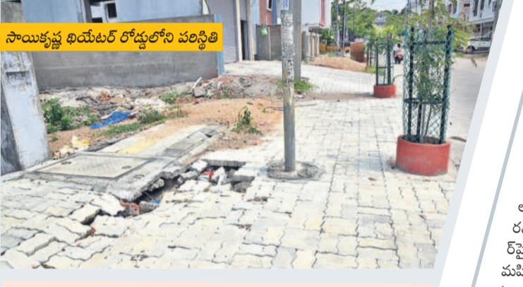
సాయికృష్ణ ఖయ్యల రోడ్డులోని పరిస్థితి

మరమ్మత్తుల కోసం అదేశాలు ఇచ్చాం నగరంలో పుట్టిపాతలు, మట్టిపర్చిన పార్కింగ్ స్థలాల్లో ఇబ్బందులు చూడటానికి కూడా వచ్చారు. వాటికి పూర్తిస్థాయిలో మరమ్మత్తులు చేయించాలని ఇప్పటికే కాంట్రాక్టర్లకు అదేశాలు ఇచ్చాం. స్టాన్డినీటీ రోడ్లన్నింటిలోనూ దెబ్బతిన్న వాటిని మరమ్మత్తు చేసేందుకు చర్యలు తీసుకుంటాం. పలు ప్రాంతాల్లో భారీ వాహనాలు రావడం, కొన్ని ప్రాంతాల్లో యజమానులు చేపట్టిన పనుల మూలంగా ట్రైల్స్ దెబ్బతిన్నాయి. వీటిని కూడా గుర్తించి చర్యలు తీసుకోవాలని ఇంజనీరింగ్ అధికారులకు సూచనలు చేశాం.