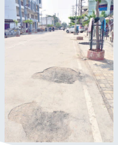
కాపువాడ నుంచి నాకపాల్వ రోడ్డు దుస్థితి