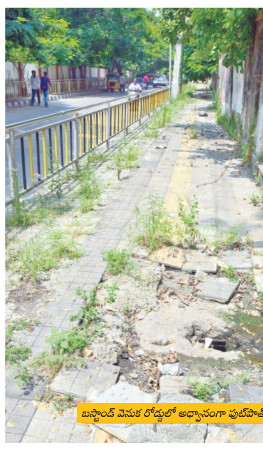
బస్టాండ్ వెనుక రోడ్డులో అధ్వానంగా ఫుట్ పాత్