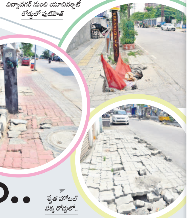
విద్యానగర్ నుంచి యూనివర్సిటీ రోడ్డులో ఫుట్ పాత్