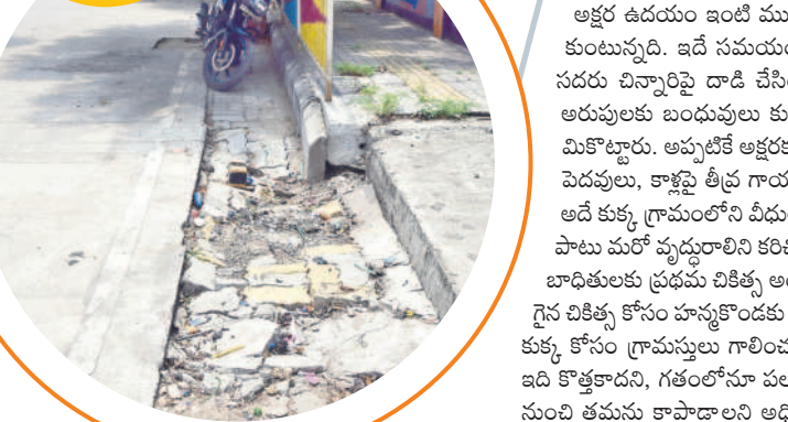
మహిళా డిగ్రీ కళాశాల సమీపంలోని ఫుట్ పాత్