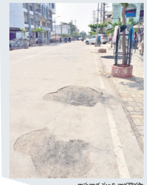
కాపువాడ నుంచి నాకపార్లమెంట్ రోడ్డు దుస్థితి