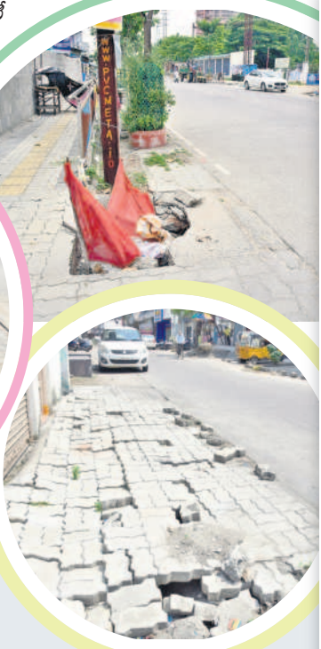
శైవ హోటల్ పక్క రోడ్డులో..