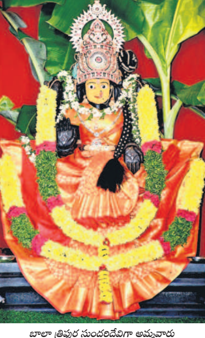
బాలా త్రిపుర సుందరిగా అమ్మవారు