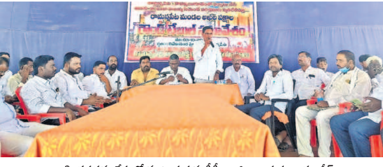
అఖిలపక్ష సమావేశంలో మూట్లకున్న సీఎం జిల్లా కార్యదర్శి జుహంగర్

మైన కుటుంబ సర్వేను ఆయన ఆస్కరిస్తూ తనిఖీ చేశారు. ఫ్యామిలీ డేటా బేస్ ఆధారంగా అధికారులు నిర్వహిస్తున్న సర్వే తీరును పరిశీలించి అవసరమైన సూచనలు చేశారు. ప్రతి ఇంటికి వెళ్లి ఆయన కుటుంబ సభ్యుల వివరాలను సేకరించి, కొత్తగా సమాచారం కాపాట్లను పేర్కొంటే వేర్వేరుగా సూచించారు. తప్పిదాలకు ఆస్కారం లేకుండా సమాచారం సేకరించాలని సూచించారు. నిర్ణీత సమయంలోనే ప్రతి ఇంటికి వెళ్లి ప్రతిపాదనలు చేపట్టాలి కలెక్టర్ హనుమంతు కే జెండగ్ అధికారులను ఆదేశించారు. బీబీనగర్ మండలంలోని మహావేదవూర్ గ్రామంలో గురువారం జరుగుతున్న ప్రారంభ