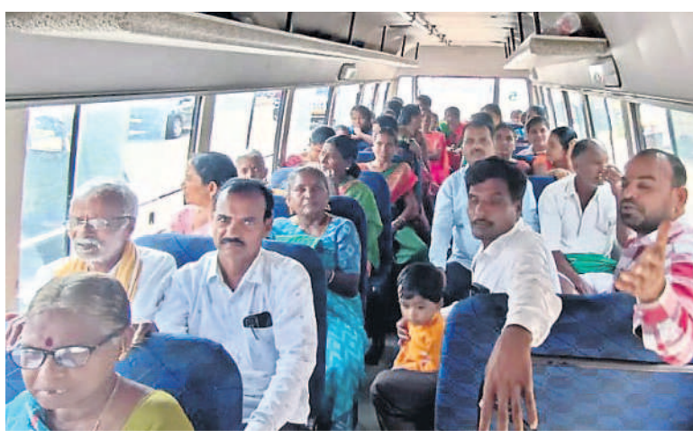
చౌటుప్పల్ నుంచి బస్సులో దర్గాకు తరలివెళ్తున్న డ్రిఫ్ట్ ఆర్ భూనియానికలలు