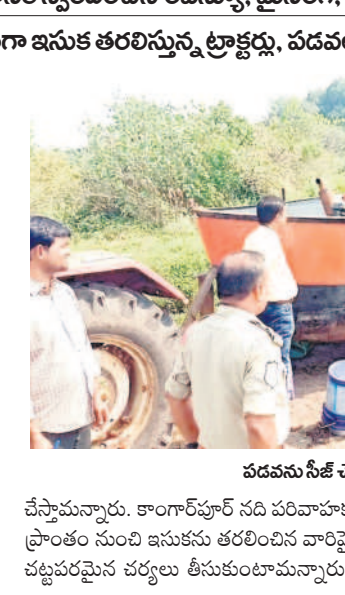
వడవను సీజ్ చేస్తున్న అధికారులు