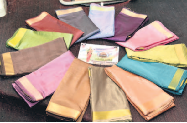
బీఆర్ఎస్ ప్రభుత్వం పంపిణీ చేసిన బతుకమ్మ చీరలు

ఆదిలాబాద్, అక్టోబర్ 4 : (నమస్తే తెలంగాణ) : పేదల సంక్షేమమే లక్ష్యంగా బీఆర్ఎస్ ప్రభుత్వం పటిష్టంగా అమలు చేసిన పథకాలకు కాంగ్రెస్ ప్రభుత్వం మంగళం పాడింది. ప్రత్యేక రాష్ట్రం ఏర్పడిన తర్వాత అన్ని వర్గాల ప్రజలు తమ పండుగలను సంతోషంగా నిర్వహించేందుకు బీఆర్ఎస్ ప్రభుత్వం సహాయ, సహకారాలు అందించింది. తెలంగాణలో ఆడబిడ్డలు ఎంతో ఘనంగా నిర్వహించే బతుకమ్మ పండుగను చీరలను పంపిణీ చేసింది. గతేడాది పండుగ వరకు చీరల పంపిణీ కోసం సాగిన ఆదిలాబాద్ జిల్లాలో 2,63,247 మంది అల్లి దారులకు అందించింది. తెలంగాణ తొలి ముఖ్యమంత్రి కేసీఆర్ ఆడబిడ్డలకు అందించిన సాయంతో మహిళలు బతుకమ్మ పండుగను సంతోషంగా నిర్వహించారు. గతంలో బీఆర్ఎస్ ప్రభుత్వం మాదిరిగా కాంగ్రెస్ ప్రభుత్వం సైతం