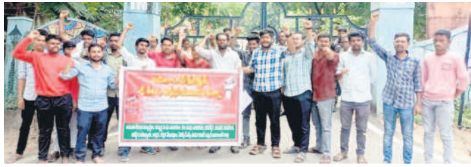
కలెక్టర్ల అందుల ధర్మా చేస్తున్న ఏజెన్సీ డిఎస్సీ సాధన కమిటీ సభ్యులు

మీ కష్టాలు తీరవరకు మీ వెంటే ఉంటా.. గుడిచూర్, అక్టోబర్ 4 : బోధో నియో జనకర్షణ ప్రణాళిక కింద 'మీ వెంటే ఉంటా.. ప్రభుత్వంతో పోరాడి సమస్యలు పరిష్కరిస్తా' అని బోధో ఎమ్మెల్యే అనిల్ జాడవ్ అన్నారు. గుడిచూర్ మండలంలోని చిన్న మల్కాపూర్, మల్కాపూర్, కొత్తగూడెం గ్రామాల్లో శుభ్రవారం బీఆర్ఎస్ నాయకులు, కార్యకర్తలతో కలిసి పర్యటించారు. ప్రతి గ్రామంలో మౌలిక వసతులు కల్పించడమే తన లక్ష్యమని తెలిపారు. 'మా పల్లెలో ఇప్పటి వరకు ఏ ఎమ్మెల్యే పర్యటించలేదు. మీరు వచ్చారు అంతే చాలు' అంటూ ఆదివాసులు హాంపు వ్యక్తం చేశారు.