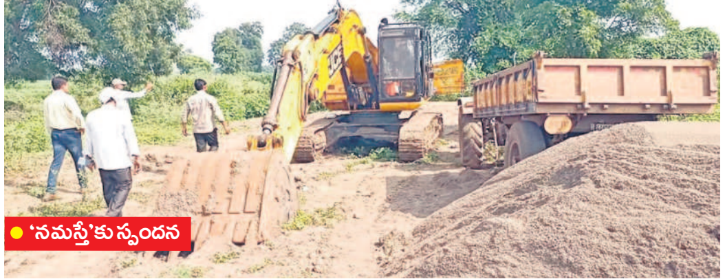
ఇసుకతో పాటు రవాణాకు ఉపయోగించే ట్రాక్టర్లు, జేసీబీ సీజ్ చేస్తున్న అధికారులు