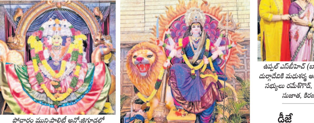
పోతారం మునిపాలిలో అన్నోజిగూడలో గాయత్రీ మాత ఆలయంలో నిజరామ దర్శనం నాగారం మునిపాలిలో రాంపల్లిలో..