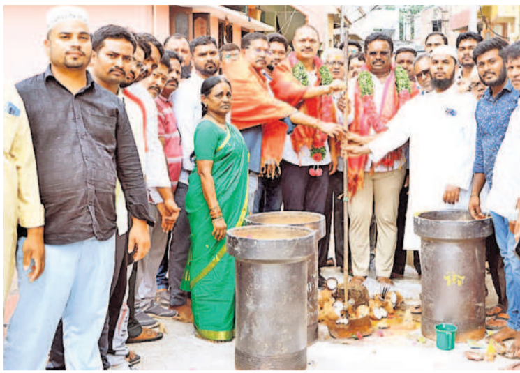
బాలాబాగ్ లో భూగర్భ డ్రైనేజీ పనులకు కార్యరేఖ దేవేందర్ రెడ్డితో కలిసి శంకుస్థాపన చేస్తున్న ఎమ్మెల్యే బండారం లక్ష్మారెడ్డి

మల్కాపూర్, అక్టోబర్ 4 : అభివృద్ధి పనుల్లో నాణ్యతా ప్రమాణాలు పాటించాలని ఎమ్మెల్యే బండారం లక్ష్మారెడ్డి అన్నారు. నియోజకవర్గంలోని ప్రతి డివిజన్ లో దశలవారీగా అభివృద్ధి పనులను చేపడుతున్నట్లు తెలిపారు. శుక్రవారం ఎమ్మెల్యే మల్కాపూర్ డివిజన్ పరిధిలోని బాలాబాగ్ కాలనీలో 17 లక్షల