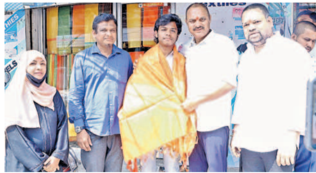
విద్యార్థిని అభినందిస్తున్న ఎమ్మెల్యే బండారం లక్ష్మారెడ్డి

వ్యయంతో భూగర్భ డ్రైనేజీ పనులకు కార్యరేఖ దేవేందర్ రెడ్డితో కలిసి శంకుస్థాపన చేశారు. దుర్గానగర్ కాలనీలో జరుగుతున్న సీసీ రోడ్డు పనులను పరిశీలించారు. ఎమ్మెల్యే మాట్లాడుతూ, కాలనీలో సమస్యలు లేకుండా ప్రత్యేక చర్యలు తీసుకుంటున్నట్లు పేర్కొన్నారు. జరుగుతున్నట్లు వంటి పనుల్లో