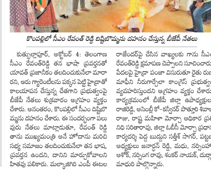
కొంపల్లిలో సీఎం రేవంత్ రెడ్డి దిష్టిబొమ్మ దహనం చేస్తున్న బీజేపీ నేతలు

కుత్బుల్లాపూర్, ఆక్టోబర్ 4: తెలంగాణ రేవంత్ రెడ్డి క్షమాపణ చెప్పాలని సూచించారు. యావత్ ప్రజాసేవకు తలదించుకునేలా మారాలని, ఆరు గ్యారెంటీలను పక్కన పెట్టి హైదరాబాద్ కాలయాపన చేస్తున్న చీకగాని ప్రభుత్వంపై మృదు దహనం చేశారు. ఈ సందర్భంగా పలు ముఖ్యమంత్రుల అనే చోదాను మరిచి పట్టణ సమాజం తలదించుకునేలా తన భాష, ప్రవర్తన ఉందని, దానిని మార్చుకోవాలని హితవు పలికారు. మల్కొండలో ఎంపీ కుటుంబం రాజేంద్రుల చేసిన వాఖ్యలకు గాను సీఎం రేవంత్ రెడ్డి క్షమాపణ చెప్పాలని సూచించారు. యావత్ ప్రజాసేవకు తలదించుకునేలా మారాలని, ఆరు గ్యారెంటీలను పక్కన పెట్టి హైదరాబాద్ కాలయాపన చేస్తున్న చీకగాని ప్రభుత్వంపై మృదు దహనం చేశారు. ఈ సందర్భంగా పలు ముఖ్యమంత్రుల అనే చోదాను మరిచి పట్టణ సమాజం తలదించుకునేలా తన భాష, ప్రవర్తన ఉందని, దానిని మార్చుకోవాలని హితవు పలికారు. మల్కొండలో ఎంపీ కుటుంబం రాజేంద్రుల చేసిన వాఖ్యలకు గాను సీఎం రేవంత్ రెడ్డి క్షమాపణ చెప్పాలని సూచించారు. యావత్ ప్రజాసేవకు తలదించుకునేలా మారాలని, ఆరు గ్యారెంటీలను పక్కన పెట్టి హైదరాబాద్ కాలయాపన చేస్తున్న చీకగాని ప్రభుత్వంపై మృదు దహనం చేశారు. ఈ సందర్భంగా పలు ముఖ్యమంత్రుల అనే చోదాను మరిచి పట్టణ సమాజం తలదించుకునేలా తన భాష, ప్రవర్తన ఉందని, దానిని మార్చుకోవాలని హితవు పలికారు. మల్కొండలో ఎంపీ కుటుంబం రాజేంద్రుల చేసిన వాఖ్యలకు గాను సీఎం రేవంత్ రెడ్డి క్షమాపణ చెప్పాలని సూచించారు.