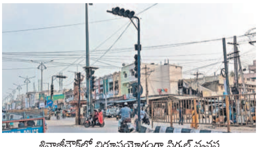
శివాజీచౌక్లో నిరూపయోగంగా సిగ్నల్ వ్యవస్థ