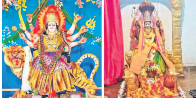
పరిగిలో గాయత్రీదేవిగా.. బొంరాన్ పేట: పోలేపల్లిలో ఎల్లమ్మ దేవాలయంలో అన్నపూర్ణాదేవిగా..

గాయత్రీదేవిగా, అన్నపూర్ణాదేవిగా అమ్మవారి దర్శనం