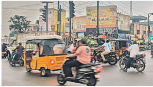
తాండూరు రూరల్, అక్టోబర్ 4 : తాండూరులో ట్రాఫిక్ సమస్య రోజు రోజుకూ జరిలంగా ముందుకు వస్తుంది. పట్టణంలో అన్నింటి ఎన్నికల ముందు ట్రాఫిక్ పోలీసు స్టేషన్ ఏర్పాటు చేశారు. కానీ పోలీసు స్టేషన్లో వసతులు లేవు. కార్యాలయం నుంచి ఎలాంటి కార్యకలాపాలు జరపడంలేదు. ట్రాఫిక్ సమస్య కారణంగా పట్టణంలోపాటు సరిహద్దుల్లో ఏదో ఒక చోట ప్రయాణాలు చేసేవారు ఉండడంతో ప్రజల్లో అందో డోషం నెలకొంది. పోలీసులు నివారణ చర్యలు తీసుకుంటున్నప్పటికీ ప్రయాణాలు సంభవిస్తూనే ఉన్నాయి. తాండూరు పట్టణం వ్యాపార, వాణిజ్య కేంద్రంగా ఉంది. వివిధ రాష్ట్రాల నుంచి భారీ సంఖ్యలో వాహనాల రాకపోకలు సాగుతుంటాయి. తాండూరు ప్రాంతంలో నాచురాయి పరిశ్రమ, సుద్ధ వ్యాపారంతోపాటు మండలంలో మూడు సిమెంట్ ఫ్యాక్టరీలు ఉండగా, తెలంగాణ సరిహద్దులోని కర్నూలులో రెండు భారీ సిమెంట్ ఫ్యాక్టరీలు ఉన్నాయి. తాండూరు మండలంలో సీసీబి, పెన్సా, ఐసీఎల్ సిమెంట్ ఫ్యాక్టరీలు ఉన్నాయి. తెలంగాణ సరిహద్దులో వికారాబాద్ సిమెంట్ ఫ్యాక్టరీ, చెట్టినాడు సిమెంట్ ఫ్యాక్టరీలు ఉన్నాయి. అయితే ఫ్యాక్టరీలకు నిత్యం ముఠా రాష్ట్ర, గజరాజ్, మధ్యప్రదేశ్, బీహార్, అంధ్రప్రదేశ్, కర్ణాటక రాష్ట్రాల నుంచి బొగ్గు, యానీ తోపాటు ఇతర సామగ్రి వస్తుంది. అంతేకాకుండా ఈ ప్రాంతం నుంచి సిమెంట్ లోడ్తో భారీ ట్రాక్టర్లు, లారీలు నిత్యం వందల సంఖ్యలో రాకపోకలు సాగుస్తూ ఉంటాయి. వీటితోపాటు స్థానికంగా నాచురాయి వ్యాపారం కోసం పలు రాష్ట్రాల నుంచి భారీగా వాహనాలు వస్తూ, పోకూ ఉంటాయి. ఈ వాహనాలన్నీ తాండూరు పట్టణంలో నుంచి వెళ్తుంటాయి. వీటి కారణంగా పట్టణంలో ట్రాఫిక్ సమస్య పెరిగి పోయింది. కాగా ఉదయం 8.30 గంటల నుంచి 10 గంటల వరకు, సాయంత్రం 4.30 గంటల నుంచి 5 గంటల వరకు పట్టణం

వెలుపలనే భారీ వాహనాలను ఆపేస్తున్నారు. దాంతో స్కూల్ టైంలో విద్యార్థులకు ఇబ్బందులు తగ్గాయి.