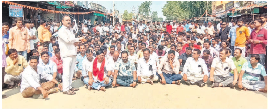
గ్రామపంచాయతీ కార్యాలయం ఎదుట ప్రధాన రోడ్డుపై ధర్నా చేపడుతున్న గిరిజనేతరులు

ఇండ్రవెల్లి, అక్టోబర్ 5 : ఇండ్రవెల్లి మండల కేంద్రంలోని వ్యవసాయ మార్కెట్ యార్జకు అనుకుని ఉన్న ప్రభుత్వ స్థలంలో నిర్మించిన ఇంటిపోటీలకు మండల కేంద్రంలో అనుమతి లేకుండా నిర్మిస్తున్న మరో ఇంటిని అధికారులు కూల్చివేశారు. ఆదిలాబాద్ కలెక్టర్ రాజుర్షి షా ఆదేశాల మేరకు శనివారం వేకువజామున రెవెన్యూ, ఇండ్రవెల్లి గ్రామ పంచాయతీ అధికారులు పోలీసు బందోబస్తు మద్దతు జేసే విధానంలో నేలమట్టం చేశారు. దీంతో ఇండ్లు కూలిన లిద్దరులతో పాటు మండలంలోని అన్ని రాజకీయ పార్టీలకు చెందిన గిరిజనేతర నాయకులు, గిరిజనేతరులు ప్రభుత్వ వైఖరికి నిరసనగా ఆందోళన నిర్వహించారు. ఇండ్రవెల్లి గ్రామ పంచాయతీ కార్యాలయాన్ని ముట్టడించారు. అనంతరం గ్రామ పంచాయతీ కార్యాలయం ఎదుట ప్రధాన రోడ్డుపై బైరాయింబి రెండు గంటలపాటు రాస్తూకో చేపట్టారు. ఉట్యూర్ డివీసిన్ నాగేందర్ గౌడ్ తో పాటు ఉట్యూర్, ఇచ్చోడ సీఐలు మిగిలి, డివీషన్, ఇండ్రవెల్లి ఎస్ఐ సునీల్, గుడిహత్యూర్ ఎస్ఐ ఇమ్మానెల్ ఆందోళనకారులను సచ్చజేప్పినా విసిపించుకో