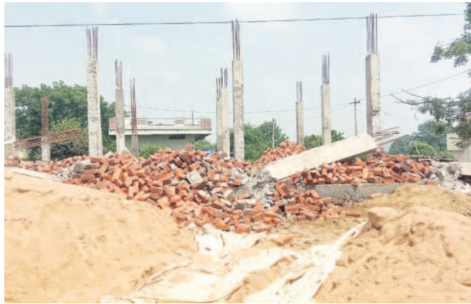
అనుమతి లేదని కూర్చా మిగిలిన ఇంటి గోడలు, పిల్లలు

ప్రభుత్వ స్థలంలో నిర్మించుకున్నారని అధికారుల దౌర్జన్యం