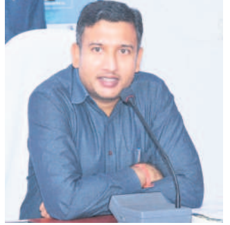
మాట్లాడుతున్న కలెక్టర్ రాజుర్షి షా

అదిలాబాద్, అక్టోబర్ 5(నమస్తే తెలంగాణ) : ప్రభుత్వ భూముల్లో నిర్మాణాలు చేపట్టవద్దని ఆదిలాబాద్ కలెక్టర్ రాజుర్షి షా ఓ ప్రకటనలో సూచించారు. ప్రైవేటు స్థలాల్లో ఇండ్లు నిర్మించుకునే వారు రెవెన్యూ, మున్సిపాలిటీ, గ్రామ పంచాయతీల అనుమతులు తప్పనిసరిగా తీసుకోవాలన్నారు. ప్రభుత్వ భూమిలో నిర్మాణాలు చేపట్టినా, ప్రైవేటు స్థలాల యజమానులు అనుమతులు తీసుకోకుండా పనులు చేపట్టారని తెలుపారు. ఇండ్లవల్ల మార్కెట్ యార్జను అనుకుని ఉన్న ప్రభుత్వ భూమిలో అక్రమంగా నిర్మించిన ఇంటిపోటీలకు ప్రైవేటు స్థలంలో అనుమతులు లేకుండా నిర్మిస్తున్న భవనాలకు రెవెన్యూ, పోలీసు, పంచాయతీ అధికారులు పరిశీలించి నోటీసులు జారీ చేశారన్నారు. నిబంధనలకు విరుద్ధంగా నిర్మిస్తున్నందున కూల్చివేసినట్లు తెలిపారు.