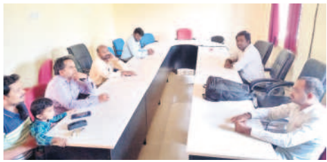
మాట్లాడుతున్న కాలాక్ష అసిస్టెంట్ ప్రొఫెసర్స్