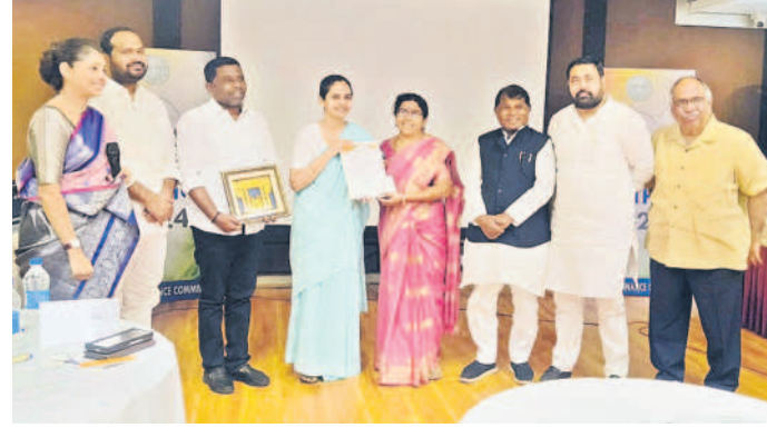
ముక్తా(శ్రీ) మాజీ సర్పంచ్ ను అధినాథులను, శార్దూ, సైకటిరి దివ్య దేవరాజున్