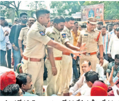
ప్రధాన రోడ్డుపై బైరాయింబి ఆందోళన చేస్తున్న గిరిజనేతరులతో మాట్లాడుతున్న సీఐలు, ఎస్ఐలు

మండల కేంద్రంలో నిర్మిస్తున్న నా ఇల్లుకు అనుమతి లేదని గ్రామ పంచాయతీ అధికారులు కూల్చివేశారు. దీంతో నాకు రూ. 2 లక్షల వరకు ఆర్థిక నష్టం జరిగింది. నిర్మాణం చేసేందుకు గ్రామ పంచాయతీ అధికారులు రక్షణ కూడా ఇచ్చారు. దీంతో నేను ఇల్లు నిర్మాణ పనులు ప్రారంభించా. ఇప్పుడేమి చేయాలో అర్థం కావడం లేదు.