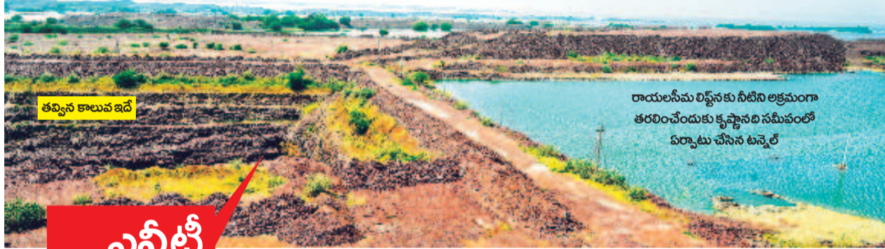
తవ్విన కాలువ బది