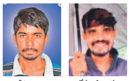
పిట్టల రాజు కార్తీవుల సాంబమూర్తి

(సింకార వెంకటేశ్వరరావు) మహబూబ్ నగర్, అక్టోబర్ 5 (నమస్తే తెలంగాణ ప్రతినిధి): కృష్ణానది సీదీని అక్రమంగా తరలించేందుకు ఏపీ సర్కార్ వేసింది. కృష్ణానదిని చెరబట్టి 100 అడుగుల లోతు 150 అడుగుల వెడల్పుతో ఏకంగా 18 కిలోమీటర్ల భారీ కాల్వ నిర్మాణానికి ఆంధ్రప్రదేశ్ పథకం రచిస్తున్నది. శ్రీశైలం రిజర్వాయర్ డెడ్ స్టాగ్ లో ఉన్నట్లు బ్యాక్ వాటర్ ను పూర్తి స్థాయిలో తరలించుకుపోయేలా రూ.3,825 కోట్లు ఖర్చు చేసి రాయలసీమ ఎత్తిపోతల పథకానికి శ్రీకారం చుట్టింది. ఇదే ఇరిగేషన్ నాగార్జునసాగర్ కు చుక్కెసి రూడా వెళ్లే పరిస్థితి ఉండదు. తెలంగాణ ప్రయోజనాలను దెబ్బతీసే ఈ ఎత్తిపోతల పథకం పూర్తయితే మహబూబ్ నగర్ జిల్లాకు తీవ్ర ముప్పుతో పాటు తెలంగాణకు కృష్ణా నది సీదీని ఇక గగనమే అని అనిపిస్తున్నది. నంద్యాల జిల్లా జూపాడు బంగా మండలం పోతులమడుగు గ్రామ సమీపంలో నిర్మిస్తున్న రాయలసీమ ఎత్తిపోతల పథకాన్ని 'నమస్తే తెలంగాణ' బృందం పరిశీలించింది. నాగర్ కర్నూల్ జిల్లా కొల్లాపూర్ మండలం సంగమేశ్వర ఆలయం సమీపం నుంచి రాయలసీమ ఎత్తిపోతల పథకానికి తప్పకుండా కాల్వ ప్రాంతాన్ని పరిశీలిస్తే విస్తుపోయే నిజాలు బయటపడ్డాయి. కృష్ణానదిపై ఆంధ్రప్రదేశ్ ప్రభుత్వం రూ.3,825 కోట్ల వ్యయంతో >10వ పేజీలో