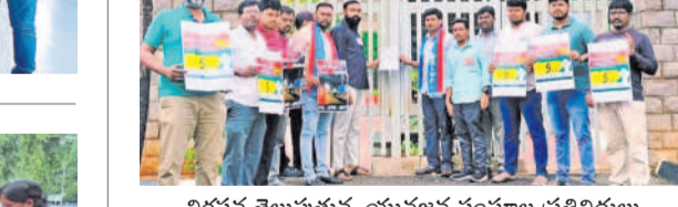
నిరసన తెలుపుతున్న యువజన సంఘాల ప్రతినిధులు