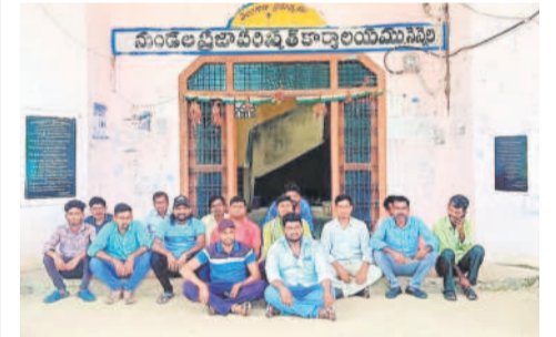
ఎంపీడీవో కార్యాలయం ముందు బెలాయింబిన జీవీ వర్కర్లు