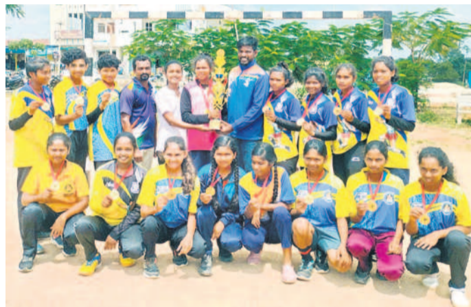
గోల్డ్ మెడల్ సాధించిన ఉమ్మడి ఆదిలాబాద్ జిల్లా హ్యాండ్ బాల్ జట్టు

మకునే నాభుడి లేకపోవడంతో గ్రామస్థులు చీకట్లో అవస్థలు పడాల్సి వస్తున్నది. మహిళలు ఉత్సాహంగా జరుపుకునే బతుకమ్మ పండుగకు వీధి వీధిని విడుదల చేయాలని గ్రామస్థులు డిమాండ్ చేస్తున్నారు.