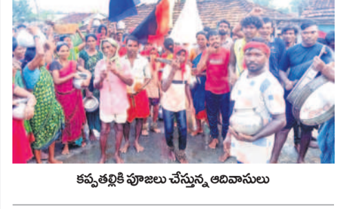
కప్పతల్లికి పూజలు చేస్తున్న అదిమానులు

బెజ్జూర్, అక్టోబర్ 5 : వర్షాలు లేక పంటలు ఎండిపోతున్నాయని, చరుణ దేవా.. కరుణించు అంటూ కుతుడ గ్రామస్థులు శనివారం ప్రత్యేక పూజలు చేశారు. కప్పతల్లిని రోకలి మద్దలో కట్టి ఊరేగిం చగా, అదిమానులు నిశ్చయ పూజలు చేశారు.