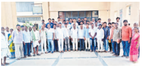
కలెక్టర్ కార్యాలయం ముందు భూ నిర్వాసితులు