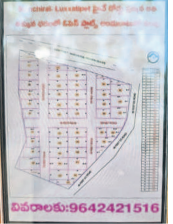
ప్రభుత్వ భూమి 10 గుంటల కలిపి ఏర్పాటు చేసిన 42 ఘాట్ల చిత్రం

మంచెర్లాల, అక్టోబర్ 5 (నమస్తే తెలంగాణ ప్రతినీధి) : ముల్కల్ల గ్రామ శివారులోని ప్రభుత్వ భూమిని కొందరు రియల్ ఎస్టేట్ వ్యాపారులు స్వాధీనం చేసుకున్నా తావిస్తున్నది. రెండేకరాల పట్టణభూమిని కొనుగోలు చేసి, దాని పక్కనున్న 10 గుంటల సర్కారు స్ట్రాబెరీ కలుపుకొని ఫ్యాటింగ్ చేసి విక్రయించేందుకు సిద్ధమవుతూ, యంత్రాంగం చూసేచూడనట్లు వ్యవహరిస్తున్నది. ముల్కల్ల గ్రామ శివారులోని సర్వే నంబర్ 169లో ముగ్గురు అన్నదమ్ములకు చెందిన 71 గుంటలు, మరో వ్యక్తికి చెందిన 22 గుంటల మొత్తం 2.13 ఎకరాల భూమిని ఇద్దరు రియల్టర్లు కొనుగోలు చేశారు. ఈ మేరకు సెప్టెంబర్ 22న అగ్రి మెంట్ సైతం చేసుకున్నారు. మొత్తంగా నలుగురు వ్యక్తుల నుంచి 2.13 ఎకరాలు కొనుగోలు చేసిన ఆ వ్యాపారులు పక్కనే ఉన్న 10 గుంటల ప్రభుత్వ స్ట్రాబెరీ కలుపుకొని మొత్తం 42 ఘాట్లను చేశారు. ఎలాంటి అనుమతులు లేకుండా అక్రమంగా వెంచర్ చేసి గజానికి రూ.13 వేల చొప్పున విక్రయించేందుకు సిద్ధమయ్యారు. ఇప్పటికే కొన్ని ఘాట్లపై అగ్రిమెంట్ చేసుకున్నారు. ఈ లెక్కల వెంచర్లో కలిపేసిన 10 గుంటల ప్రభుత్వ భూమిపై రూ.1.57 కోట్ల సముకూర్పుకునేందుకు సిగ్గు వేసానని తెలిపింది.