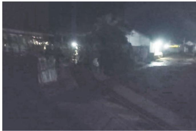
చీకట్ల రాజారం గ్రామ పంచాయతీ