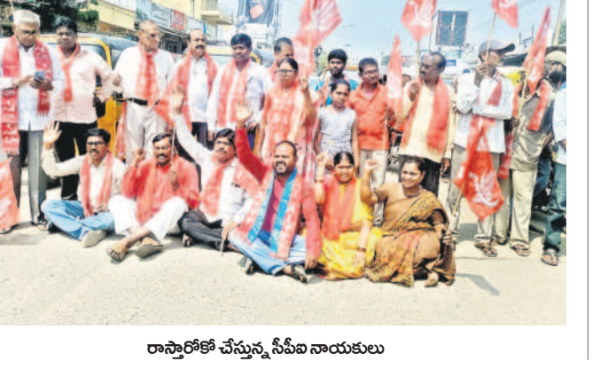
రాస్తారోళ్లే చేస్తున్న సీపీఐ నాయకులు