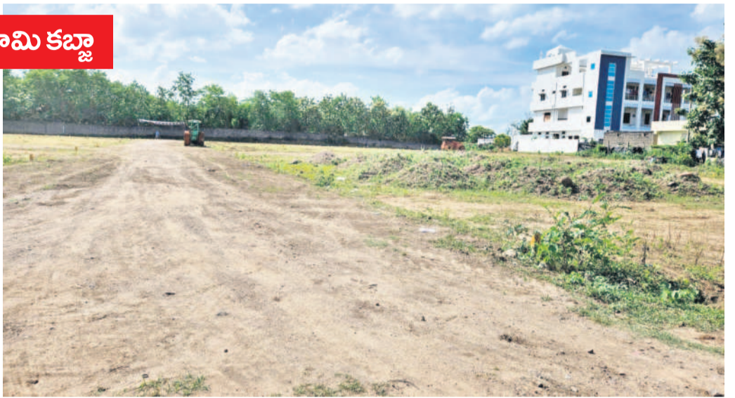
ముల్కల్ల శివారులో ఏర్పాటు చేసిన అక్రమ వెంచర్

డీటీసీపీ అనుమతి తీసుకోవాలి. డీటీసీపీకి దరఖాస్తు చేసుకున్నాక గ్రామపంచాయతీకి కొంత భూమిని మార్కెట్ చేసి మిగిలిన ఘాట్లను విక్రయించాలి. ఇలా చేస్తే టైమ్ పట్టు డంతో ఘాటు 10 శాతం ఘాట్లు పంచాయతీ చేతిలోనే ఉండిపోతాయి. పైగా డీటీసీపీకి ఫోటో అక్రమం చేసి 10 గుంటల వ్యవహారం అదృష్టవశాత్తుకునేందుకు సిద్ధమయ్యారు. ఎలాంటి అనుమతులు లేకుండా వెంచర్ ఏర్పాటు చేసారు. మరీ అనుమతులు లేకుండా రిజిస్ట్రేషన్ ఎలా చేస్తారు... అలా చేయడానికి రూల్స్ బ్రేక్ చేశారు. అని వెంచర్ నిర్వాహకులు ప్రశ్నిస్తే.. నాలా కన్వర్షన్ చేసి ఘాట్లను రిజిస్ట్రేషన్ చేసిస్తామని చెప్పారు. ఈ మేరకు సబ్ రిజిస్ట్రార్ ఆఫీసులో అలా సెల్ చేశామన్నారు. మరీ అప్పుడైనా ఈ 10