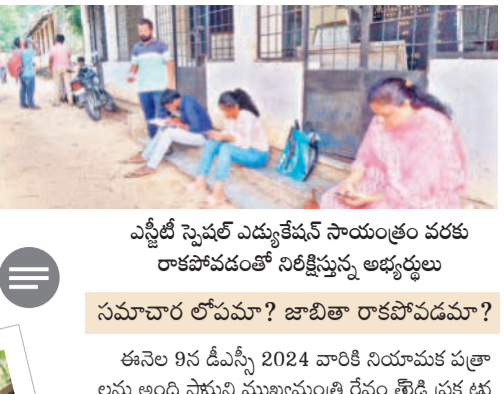
ఎస్టీటీ స్పెషల్ ఎడ్యుకేషన్ సాయంత్రం వరకు రాకపోవడంతో సర్టిఫికేషన్ అభ్యర్థులు సమాచార లోపమా? జాబితా రాకపోవడమా?

ఈనెల 9న డిఎస్సీ 2024 వారికి నియమక ప్రకారం అంది స్టాఫును ముఖ్యమంత్రి కేసీఆర్ ప్రకటన చేశారు. ప్రవేశపత్రాల పంపిణీలను హాజరు వారికి మాత్రమే పోషించేలా కేటావారు. రాని వారి వర్సిఫైడ్ ఏ మిటర్లు, పూర్తి స్థాయిలో వారికి సమాచారం అందించా అనే ప్రశ్నలు మిగిలాయి. ఎస్టీటీ స్పెషల్ ఎడ్యుకేషన్ లో 20వేల స్థానాలు ఉండగా 1:3 ప్రకారం 60 మంది అభ్యర్థులను పిలవాలి. మరి ఈ జాబితాలు ఏమి య్యాయనే సందేహాలు ఉన్నాయి. జిల్లా లోని నిరుద్యోగి గణాంకం వేదికల నుండి ఈ విషయంపై డిఎస్సీ సందేహాలను సందేహంగా, ఉన్నతాధికారుల ఆదేశాల మేరకు ముందుకు సాగుతున్నారని ఎస్టీటీ స్పెషల్ ఎడ్యుకేషన్ కోర్టు కేసు ఉంది. గడువు ముగిసిన సమయంలోకి 576 మంది అభ్యర్థులకు గానూ 552 మంది హాజరు కాగా, 24 మంది గైర్ హాజరు య్యారు. 2018 డిఎస్సీకి సంబంధించి 186 మంది గైర్ హాజరు అయ్యారని పేర్కొన్నారు.