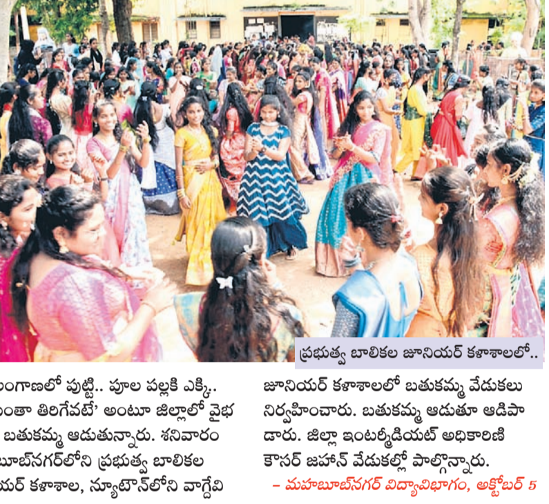
ప్రభుత్వ బాలబడి జూనియర్ కళాశాలలో..