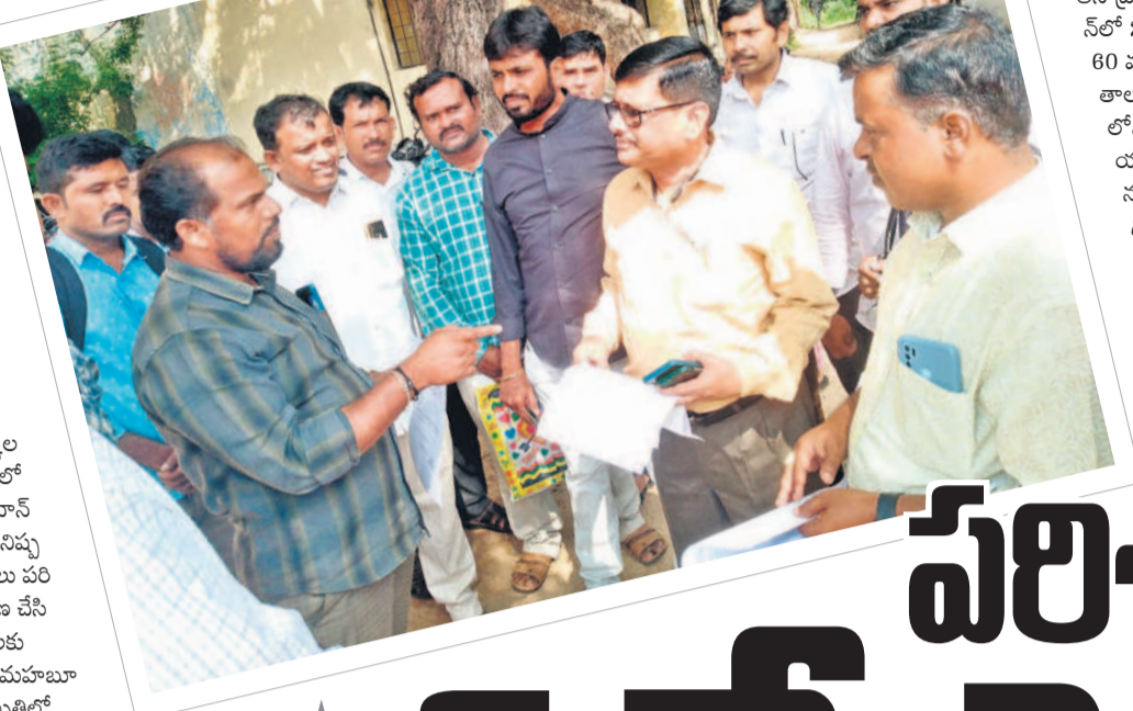
సర్టిఫికేట్ వెరిఫికేషన్ కేంద్రం వద్ద మహబూబ్ నగర్ డివిజన్లో మాట్లాడుతున్న ఏజెన్సీ ప్రాంతాల గిరిజన అభ్యర్థులు

మహబూబ్ నగర్ విద్యా ఖాతా, అక్టోబర్ 5 : డిఎస్సీ-2024 రాజ పరీక్ష ఫలితాల్లో 1:3కి ఎంపికైన అభ్యర్థుల ప్రవేశపత్రాల పంపిణీని ముగించినందుకు సహాయక కార్యదర్శిని ప్రశంసించింది. ప్రవేశపత్రాల పంపిణీ పరిధిలో 74,107 ప్రకారం ఉద్యోగాలను నియమించింది. అభ్యర్థులు వాటిని పరిశీలించి, సరైన సమాచారం ఉన్నట్లుగా తనిఖీ చేసి, అభ్యర్థులకు అభ్యర్థన పత్రాలను పంపిణీ చేసింది. ప్రవేశపత్రాల పంపిణీ పరిధిలో 74,107 ప్రకారం ఉద్యోగాలను నియమించింది. అభ్యర్థులు వాటిని పరిశీలించి, సరైన సమాచారం ఉన్నట్లుగా తనిఖీ చేసి, అభ్యర్థులకు అభ్యర్థన పత్రాలను పంపిణీ చేసింది.