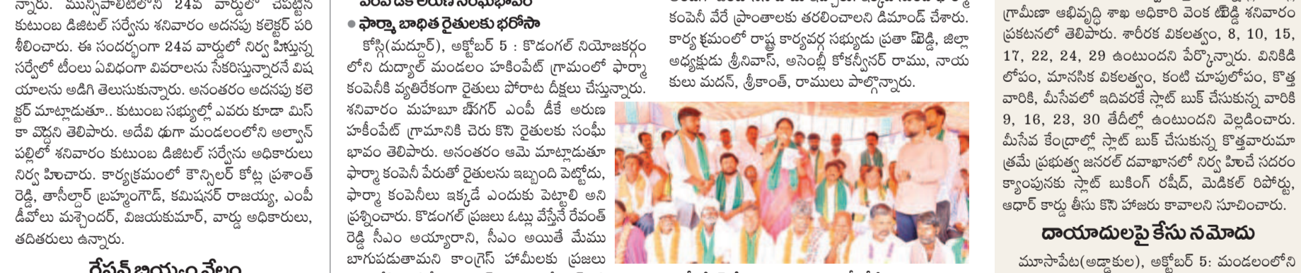
భయపడొద్దు.. మీకు నేనున్నా.. భయపడొద్దు.. మీకు నేనున్నా..

భయపడొద్దు.. మీకు నేనున్నా.. భయపడొద్దు.. మీకు నేనున్నా.. భయపడొద్దు.. మీకు నేనున్నా..