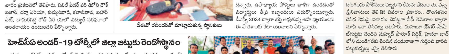
ఉర్దూ మీడియం పాఠశాలకు ఉపాధ్యాయులను కేటాయిండావి

ఉర్దూ మీడియం పాఠశాలకు ఉపాధ్యాయులను కేటాయిండావి. ఉర్దూ మీడియం పాఠశాలకు ఉపాధ్యాయులను కేటాయిండావి.