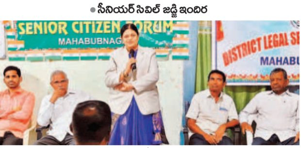
సీనియర్ సిటిజన్ ఫారం సేవలు అమూల్యం

సీనియర్ సిటిజన్ ఫారం సేవలు అమూల్యం. సీనియర్ సిటిజన్ ఫారం సేవలు అమూల్యం.