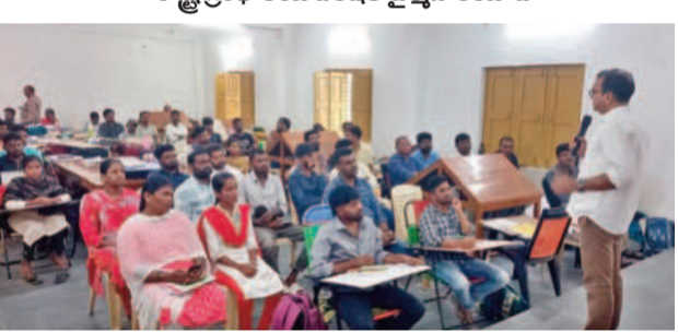
గ్రంథాలయంలో పుస్తకాలు అందుబాటులో ఉంచావి

గ్రంథాలయంలో పుస్తకాలు అందుబాటులో ఉంచావి. గ్రంథాలయంలో పుస్తకాలు అందుబాటులో ఉంచావి.