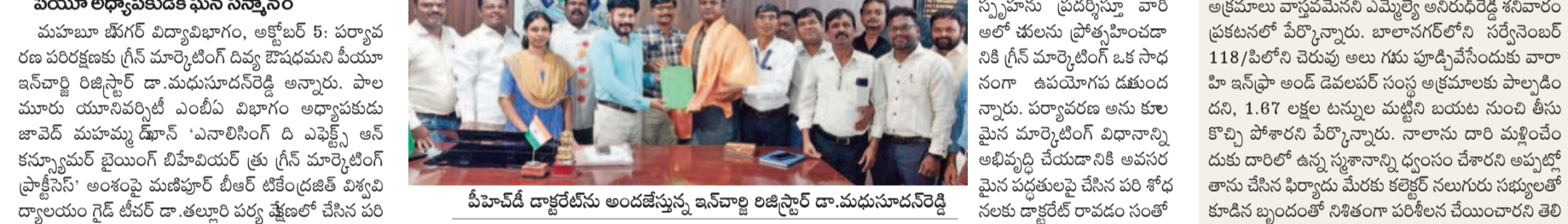
పర్యావరణానికి గ్రీన్ మార్కెటింగ్ దివ్య ఔషధం

పర్యావరణానికి గ్రీన్ మార్కెటింగ్ దివ్య ఔషధం. పర్యావరణానికి గ్రీన్ మార్కెటింగ్ దివ్య ఔషధం.