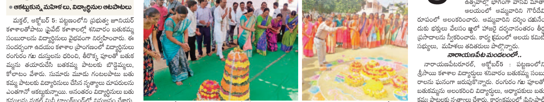
రామరామ ఉయ్యాలో.. రామరామ ఉయ్యాలో.. రామరామ ఉయ్యాలో..

రామరామ ఉయ్యాలో.. రామరామ ఉయ్యాలో.. రామరామ ఉయ్యాలో.. రామరామ ఉయ్యాలో..