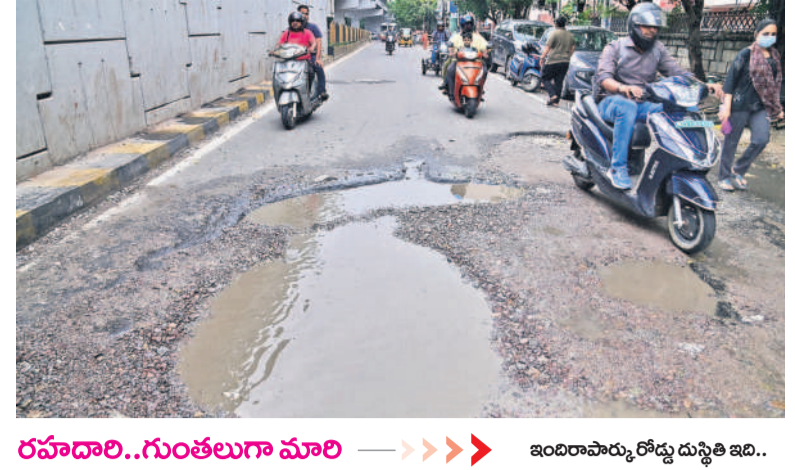
రహదారి..గుంతలుగా మారి ఇందిరాపార్కు రోడ్డు దుస్థితి ఇది..