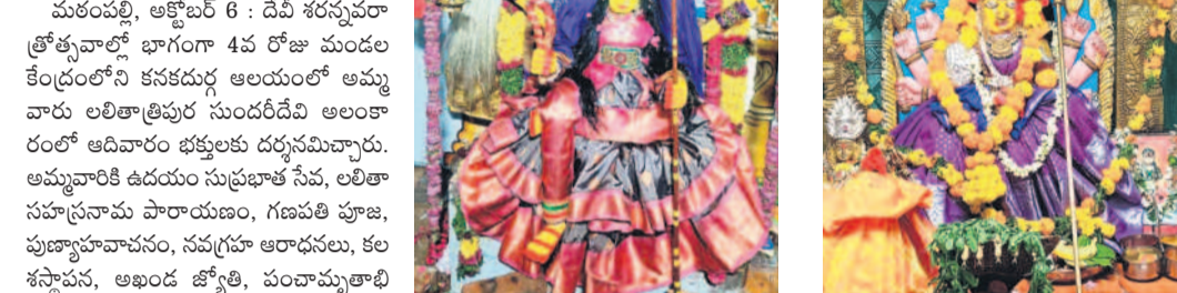
మేళ్లచెర్వులో లలితాత్రిపుర సుందరీదేవిగా దుర్గామాత

సూర్యాపేట లోని అక్టోబర్ 6 : దేవీ శరన్నవరాత్రి త్రోవవారల్లో భాగంగా 4వ రోజు మండల కేంద్రంలోని కనకదుర్గ ఆలయంలో అమ్మవారు లలితాత్రిపుర సుందరీదేవి అలంకారంలో ఆదివారం భక్తులకు దర్శనమిచ్చారు. అమ్మవారికి ఉదయం సుప్రభాత సేవ, లలితా సహస్రనామ పారాయణం, గణపతి పూజ, పుణ్యాహవాచనం, నవగ్రహ ఆరాధనలు, కల శశూపన, అఖండ జ్యోతి, పంచామృతాభిషేకం, కుంకుమపూజ, నీరాజన మంత్ర పుష్పాలు, తీర్ధప్రసాదం తదితర పూజలు శాస్త్రోక్తంగా జరిపారు.