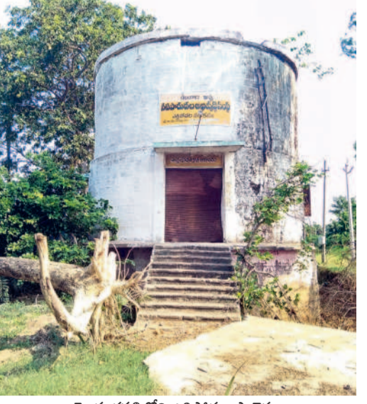
మారంచపల్లిలోని ఎత్తిపోతల ప్రాజెక్టు

గత ఏడాది వరదలకు మారంచవాగు ఉప్పొంగింది. దీంతో మారంచపల్లి గ్రామం నీటి మునిగి ఆస్తి, ప్రాణ నష్టం జరిగింది. ఈ క్రమంలోనే వాగుపై ఉన్న మారంచ ఎత్తిపోతల పథకం (లిఫ్ట్ ఇరిగేషన్) పనికొరకుండా పోయింది. ఫలితంగా ఈ ప్రాజెక్ట్ పైనే ఆధారపడి వ్యవసాయం చేస్తున్న 220 మంది రైతుల పాలటలు నీరందని పరిస్థితి నెలకొంది. గత వానకాలం, యానగి పంటలు కోల్పోయిన అన్నదాతలకు ఈసారి చుక్కెదురైంది. చెడిపోయిన మొలార్లు, ధ్వంసమైన ట్రాన్స్మిషన్లను మరమ్మత్తు చేసే నీటిని ఎత్తిపోతలనుకున్న వారి ఆశలు అడియాశలయ్యాయి. ప్రస్తుతం నీరు లేక, రాక పంటలు వేయకపోవడంతో భూములన్నీ బీళ్లుగా మారాయి. పంటలు పట్టించుకోకపోవడం, అధికారులు ప్రాజెక్ట్ వైపు కన్నెత్తి చూడకపోవడంపై రైతులు మండిపడుతున్నారు. ఈ లిఫ్ట్ పైనే ఆధారపడిన తమకు నికేవరంటూ ఆందోళన చేస్తున్నారు. - జయశంకర్ భూపాలపల్లి, అక్టోబర్ 6 (నమస్తే తెలంగాణ)