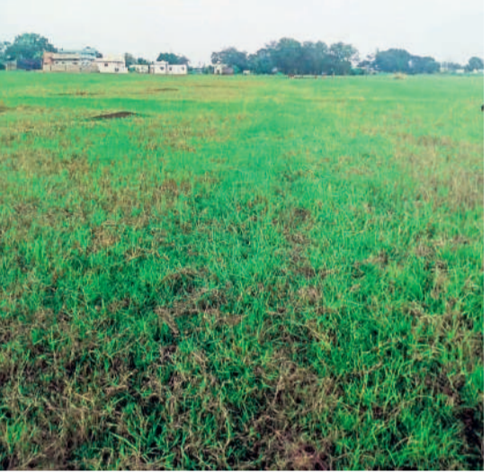
సాగు చేయకపోవడంతో బీడుగా మారిన పంట పొలాలు

మారంచ ఎత్తిపోతల పథకాన్ని 1970లో నిర్మించగా అప్పుడు 1260 ఎకరాల ఆయకట్టుగా నిర్మించారు. క్రమంగా ఆయకట్టు తగ్గుతూ వస్తున్నప్పటికీ మారంచపల్లి పరిసర గ్రామాలకు చెందిన 220 మంది రైతులు దీనిపైనే ఆధారపడి పంటలు పండించుకుంటారు. ఈ ప్రాజెక్ట్ నీటి మునగడంతో గత వానకాలం, యానగిలో దీని కింద 600 ఎకరాల్లో పంటలు వేయలేదు. రెండు సీజన్లలో కలిపి దాదాపు రూ. 30 కోట్ల వరకు పంటను అందించేందుకు ఏర్పాట్లు చేసేటప్పుడు సైతం పోతల బావి కోతకు గురికాగా, మోటు పంటలను నీటి ఎత్తిపోతలతో రైతులు తమ భూములను బీళ్లుగా వదిలేశారు. బీజిఎస్ ప్రభుత్వంలో