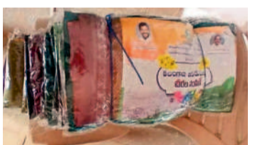
రావాల్లి ఉండగా, 4870 చీరెలు మండల కేంద్రానికి చేరాయి. గోవిందరావుపేటకు 7506 మందికి 6380 చీరెలు, ములుగుకు 15933 మందికి 13540 చీరెలు, వెంకటాపురంకు 8051 మందికి 6840 చీరెలు, కన్నామిగిడికి 3025 మందికి 2570 చీరెలు, ఏటూరునాగారానికి 7205 మందికి 6120 చీరెలు, మంగపేటకు 12107 మందికి 10300 చీరెలు, వెంకటాపురంకు 5538 మందికి 4700 చీరెలు వచ్చాయి. అదేవిధంగా జిల్లాలోని అందరినీ పరిధిలో ఉన్న గ్రామాలకు చెందిన గిరిజన మహిళల్లో 18 ఏళ్ల నిండిన మహిళలు 33155 ఉండగా, వీరికి చీరెలను ఇంకా సరఫరా చేయలేదు. బతుకమ్మ పండుగ లోపు అందించేందుకు అధికారులు పర్యటన తీసుకుంటున్నారు. నేటి నుంచి మహిళా సంఘాల ద్వారా బతుకమ్మ చీరెలను పంపిణీ చేయనున్నారు. వాణిజ్య మండలానికి చేరిన 4700 చీరెలు