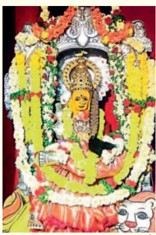
మహాలక్ష్మి అలంకరణలో దర్శనమిస్తున్న భద్రకాళీ అమ్మవారు