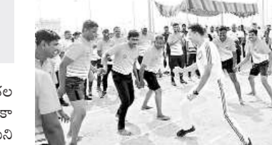
క్రీడల్లో పాల్గొన్న ఎస్సీ అఖిల్ మహాజన్

తెలంగాణ చౌక్, అక్టోబర్ 7 : శాంతిభద్రతల పరిరక్షణలో విత్తం బిజోగా ఉండే పోలీస్ అధికారులకు క్రీడలు మానసికోల్లాసాన్ని ఇస్తాయని ఎస్సీ అఖిల్ మహాజన్ అన్నారు. సోమవారం జిల్లా కేంద్రంలోని మిసి స్టేడియంలో పోలీస్ శాఖ ఆధ్వర్యంలో నిర్వహించిన రెండో వార్షిక అథ్లెటిక్స్ క్రీడలను కూడా నిర్వహిస్తున్నట్లు హిందీ లాంఛనంగా ప్రారంభించారు. అధికారులు, సిబ్బంది ప్రతి ఒక్కరికీ డ్యూటీ, కుటుంబ ఆర్థికమందానికి, శారీరక దృఢ