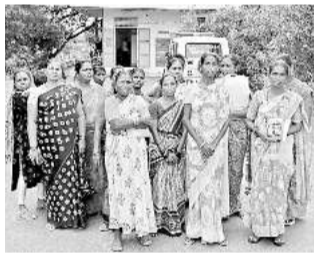
పోలీస్ స్టేషన్లో ఫిర్యాదు చేసిన మహిళలు