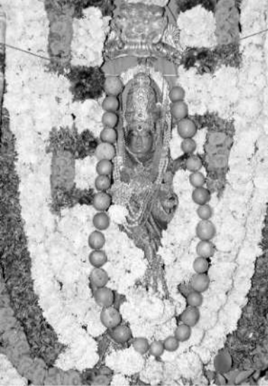
స్కందమాత ఆలయంలో దర్శనమిచ్చిన అమ్మవారు

వేములవాడ టౌన్, అక్టోబర్ 7 : దేవి సహాయంతో భాగంగా వేములవాడ శ్రీ రాజన్న ఆలయంలో ప్రతిష్ఠించిన అమ్మవారు సోమవారం స్కందమాత ఆలయంలో భక్తులకు దర్శనమిచ్చారు. ఉదయం ఆలయ ప్రాంగణంలోని నాగిరెడ్డి మండపంలో కొలువైన అమ్మవారికి ఆలయ ఆర్చకులు, వేదపండితులు స్వామివారికి మహానామసమర్పణ ప్రకారం రుద్రాభిషేకం నిర్వహించారు. ఆనంతరం, రాజరాజేశ్వరీదేవికి అభ్యంగన స్నానం, మహాభిషేకం తదితర పూజలు నిర్వహించారు. నాగిరెడ్డి మండపంలో ఘనంగా హావనం నిర్వహించారు. రాత్రి అమ్మవారికి పట్టణ పురవీధుల్లో విహారస్థ భక్తులను ఆహ్వానించారు. ఈ కార్యక్రమంలో ఆలయ ఆర్చకులు, వేదపండితులు, అధికారులు, వివిధ పార్టీల నాయకులు పాల్గొన్నారు.