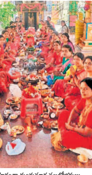
సామాజికంగా కుంకుమార్చనలో భక్తులు