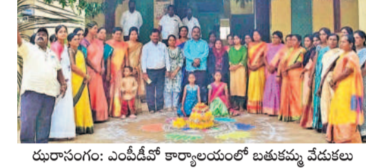
ధూరాసంగం: ఎంపీడిలో కార్యాలయంలో బతుకమ్మ వేడుకలు