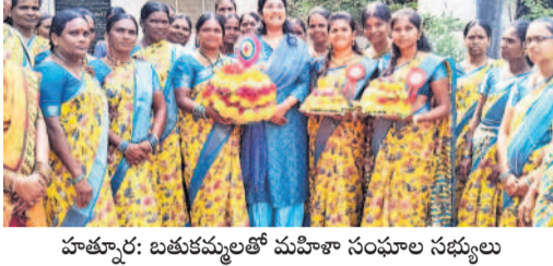
హతూర్: బతుకమ్మతో మహిళా సంఘాల సభ్యులు