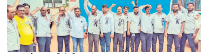
కవేలి నియంట్ గోడైన్ పరిశ్రమ ఎదుట నిరసన తెలుపుతున్న కార్మికులు

కోపేర్, అక్టోబర్ 7: కవేలి రాకెట్ పూల్ (సి యంట్ గోడైన్) పరిశ్రమ యాజమాన్యం వెంటనే న్యాయం చేయాలని సీబీఐ యాజమాని జహీరాబాద్ క్లస్టర్ కన్వీనర్ మహిళా పోలీస్ డివిజన్ చేశారు. సోమవారం పరిశ్రమ యాజమాన్యం వేతన ఒప్పందం చేయడంలో అసహకారం వ్యవహరిస్తున్నదని ఆరోపిస్తూ సీబీఐ యాజమాన్యంలో దర్యా నిర్వహించారు.