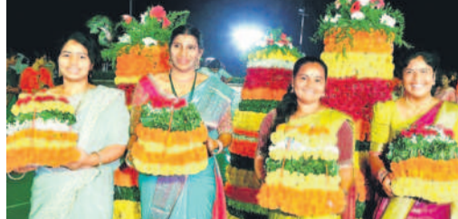
ఎన్నో కార్యాలయంలో బతుకమ్మతో మహిళా సిబ్బంది