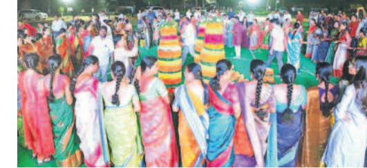
ఎన్నో కార్యాలయంలో బతుకమ్మ ఆడుతున్న మహిళలు