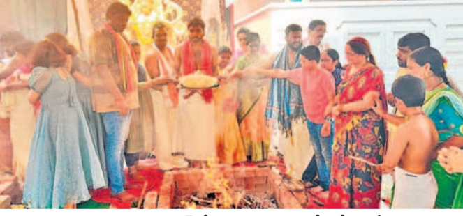
రామచంద్రాపురం: మల్లికార్జునగర్లో అమ్మవారి సన్నిధిలో హోమం చేస్తున్న భక్తులు