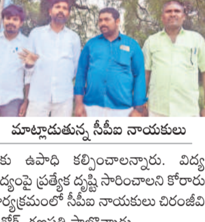
మాట్లాడుతున్న సీపీఐ నాయకులు