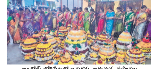
అందోల్: జోగిపేటలో బతుకమ్మ ఆడుతున్న మహిళలు