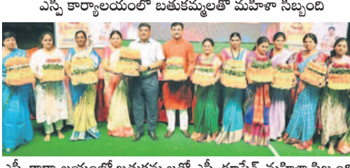
ఎన్నో కార్యాలయంలో బతుకమ్మతో ఎన్నో రూపాల్లో మహిళా సిబ్బంది