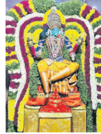
బోల్లారం: శ్రీవారిశాల అవతారంలో భవన అమ్మవారు