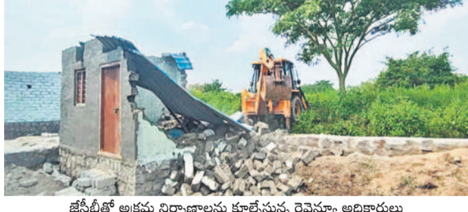
జేసీటీఆర్ అక్రమ నిర్మాణాలను కూల్చేస్తున్న రెవెన్యూ అధికారులు

జిన్నారం, అక్టోబర్ 7: ఖాజీపల్లి గ్రామ పంచాయతీ పరిధిలోని ప్రభుత్వ భూమిలో చేపట్టిన అక్రమ నిర్మాణాలను రెవెన్యూ అధికారులు సోమవారం కూల్చివేశారు. సర్వేలో బర్ 181 ప్రభుత్వ భూమిలో రాత్రికి రాత్రి అక్రమంగా నిర్మించిన నాలుగు నిర్మాణాలను తహసీల్దార్ బిక్షపతి అధికారి మేరకు ఆరేవ