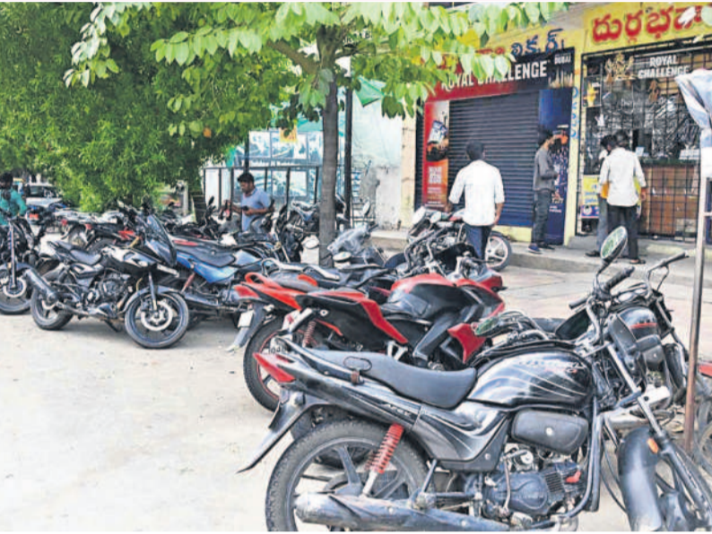
సిద్దిపేట పట్టణంలోని ఒక బెల్ట్ షాపు వద్ద లోపల మందు... బయట బండ్లు

ప్రత్యేక సందర్శాలు ఉన్నప్పుడు వైన్లను బండ్ చేయాలి కానీ పక్కనే చిన్నపాటి రూమును కిరాయికి తీసుకొని అందులో మద్యం ఉంచి అమ్ముతున్నారు. మద్యం దుకాణం ముందు ఇష్టానుసారా వాహనాలను పార్కింగ్ చేస్తున్నారు. ఆరవారం గుండా పోయేవారికి తీవ్ర ఇబ్బంది ఎదురవుతున్నది. ప్రతి మద్యం దుకాణానికి ఒక గదిని మద్యం తాగడానికి ప్రభుత్వం అనుమతి ఇచ్చింది. అక్కడ గది లేకపోతే మద్యం కొనుగోలు చేసి తీసుకొని పోవాలి ఉంటుంది. కానీ మద్యం ప్రైవేటు రోడ్డు మీదనే తాగేస్తూ బాటసారులకు ఇబ్బంది కలిగిస్తున్నారు. ప్రభుత్వ నిబంధనల ప్రకారం సిని కెమెరాలు ఏర్పాటు చేసి మద్యం దుకాణాల ముందు ఏం జరుగుతుంది అనే విషయాన్ని పర్యవే