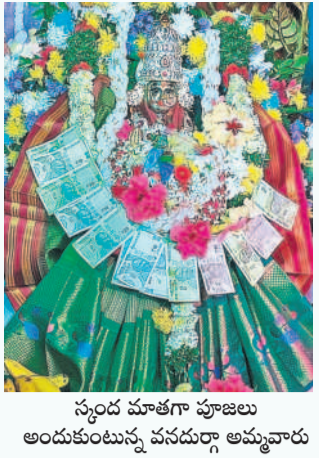
స్వంద మాతగా పూజలు అందుకుంటున్న వనదుర్గా అమ్మవారు