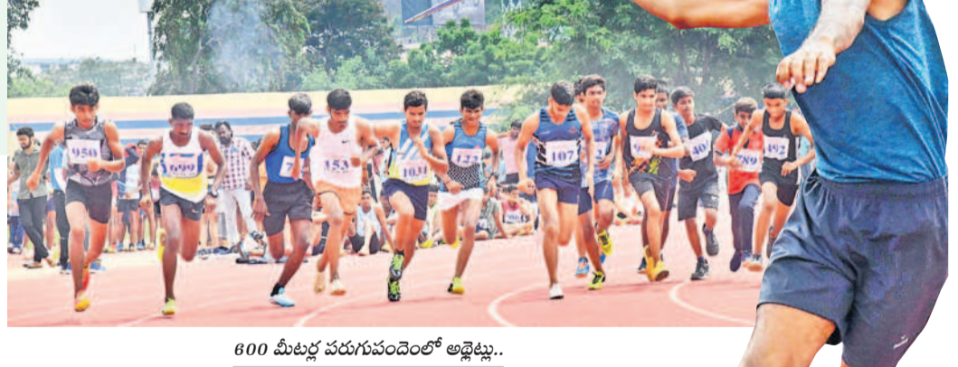
600 మీటర్ల పరుగుపందెంలో అడ్లెటిక్స్..