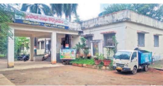
నర్సంపేట మున్సిపాలిటీ కార్యాలయం

నర్సంపేట, అక్టోబర్ 7 : నర్సంపేట మున్సిపాలిటీ ఇక కార్పొరేషన్ గా మారనున్నది. పట్టణానికి ఐదు కిలోమీటర్ల దూరంలో ఉన్న పది గ్రామాలను విలీనం చేసి నగరపాలక సంస్థగా అవ్వగోరి చేసేందుకు రంగం సిద్ధమవుతోంది. ఇప్పటికే మున్సిపల్ అధికారులు ఇందుకు సంబంధించి ప్రతిపాదనలు రూపొందించగా ఎమ్మెల్యే, ప్రభుత్వ పరిశీలన కోసం సమర్పించారు. తాజాగా కలెక్టరు ఆఫ్ఫీస్ చేరగా డిప్యూటీ మున్సిపల్ అడ్మినిస్ట్రేషన్, అర్బన్ డెవలప్ మెంట్ కు చేరగా గ్రామ పంచాయతీ, మున్సిపాలిటీ ఎన్నికలకు ముందే ఈ ప్రక్రియను పూర్తి చేసేందుకు అధికారులు కనీసం చేస్తున్నారు.