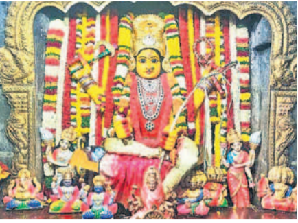
వరంగల్ : లలితా మహా త్రిపుర సుందరి అలంకరణలో భద్రకాళీ అమ్మవారు