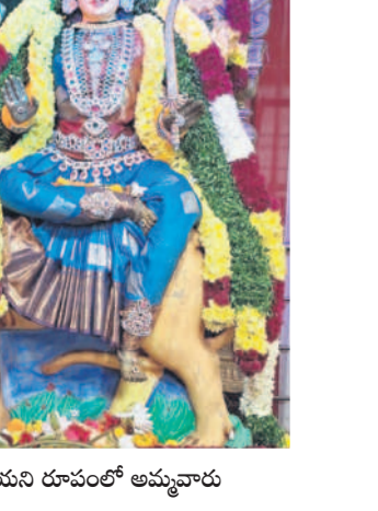
హిందూమతాన్ని ప్రోత్సహించే ఏర్పాట్లు చేశారు. అమ్మవారికి ప్రభుత్వం తరఫున పట్టు వస్త్రాలను సమర్పించారు. మూల నక్షత్ర పూజకు భక్తులు అధిక సంఖ్యలో హాజరయ్యే అవకాశం ఉంది. ఇబ్బందులు తలెత్తకుండా అధికారులు ఏర్పాటు చేశారు.