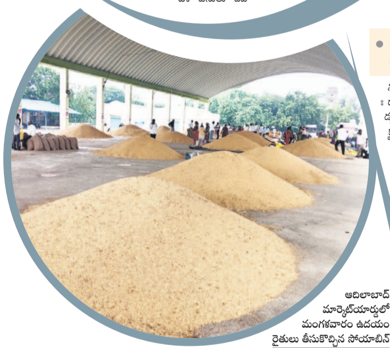
అదిలాబాద్ మార్కెట్ యార్డులో మంగళవారం ఉడయూర్ రైతులు తీసుకొచ్చిన సోయాబిన్

కాకుండా, పనులకు శంకుస్థాపన కూడా చేశారు. పనులు మొదలవుతాయని భావిస్తున్న తరుణంలోనే ఎన్నికలు రావడం.. ఆ తర్వాత కాంగ్రెస్ అధికారంలోకి రావడంతో పరిస్థితులు తలకిందులయ్యాయి. అభివృద్ధి పనులను నిలిపివేసిన కాంగ్రెస్ ప్రభుత్వం కాంగ్రెస్ ప్రభుత్వం అధికారంలోకి వచ్చిన వెంటనే బీఆర్ఎస్ హయాంలో మంజూరైన అభివృద్ధి పనులను నిలిపివేయాలని అధికారులను ఆదేశించింది. ఇందులో భాగంగానే 19 చెక్ డ్యాంల పనులను చేపట్టవద్దని, మంజూరైన నిధులను వెనక్కి తీసుకుంటున్నట్లు ప్రకటించింది. దీంతోపాటు అప్పటికే పూర్తయిన అభివృద్ధి పనులను కూడా రద్దు చేయాలని నిర్ణయించింది. అయితే బీఆర్ఎస్ హయాంలో అధికారులు రూపొందించిన అంచనాల కన్నా తక్కువ ధరలతో టెండర్లు దాఖలు కావడం, అలాగే టెండర్ల వేసిన ఏజెన్సీలకు నిర్మాణ రంగంలో మంచి అనుభవం ఉన్న కారణంగా కాంగ్రెస్ ప్రభుత్వం తిరిగి ఈ చెక్ డ్యాంల నిర్మాణ పనులను పాత ఏజెన్సీలతోనే చేపట్టేందుకు నిర్ణయించింది. దీనికి అనుగుణంగానే నీటిపారుదల శాఖ అధికారులకు ఆదేశాలు జారీ చేసింది. అయితే ఆయా నియోజకవర్గాల ముఖ్య నాయకుల ఒత్తిళ్ల కారణంగానే పనులను చేపట్టేందుకు కాంట్రాక్టర్లు ముందుకు రావడం లేదు. ఒక వేళ పనులు చేప