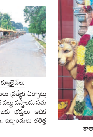
భక్తుల కోసం ఏర్పాటు చేసిన క్యూలైన్లు

● విద్యుద్ధీపాల వెలుగులో ఆలయం ● అక్షర శ్రీకారాలకు పోలికైన భక్తజనం ● నేడు మూల నక్షత్ర పూజలు బాసర, అక్టోబర్ 8 : బాసర సరస్వతీ క్షేత్రంలో నవరాత్రి ఉత్సవాలు వైభవంగా కొనసాగుతున్నాయి. ఆరో రోజైన మంగళవారం అమ్మవారు, కాత్యాయని రూపంలో దర్శనం ఇచ్చారు. భక్తులు తమ చిన్నారిలకు అక్షర శ్రీకార పూజలు నిర్వహించారు. అమ్మవారి దర్శనానికి భక్తులు భారీ సంఖ్యలో తరలివచ్చారు. రద్దీ అధికంగా ఉండడంతో గంటల తరబడి క్యూలైన్ లో వేచి ఉన్నారు. నేడు మూల నక్షత్ర పూజలు బుధవారం మూల నక్షత్ర పూజలు నిర్వహించారు. మూల నక్షత్ర పూజలు నిర్వహించే సందర్భంగా అధికారులు ఏర్పాటు చేశారు.