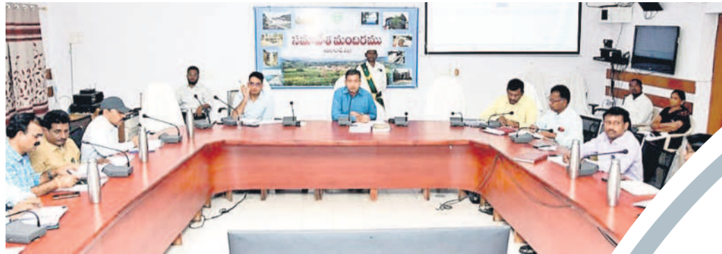
సమీక్షలో మాట్లాడుతున్న ఆదిలాబాద్ కలెక్టర్ రాజర్షి షా