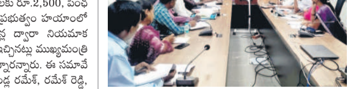
సమావేశంలో పాల్గొన్న అదనపు కలెక్టర్