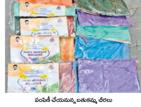
పంపిణీ చేయనున్న బతుకమ్మ చీరలు