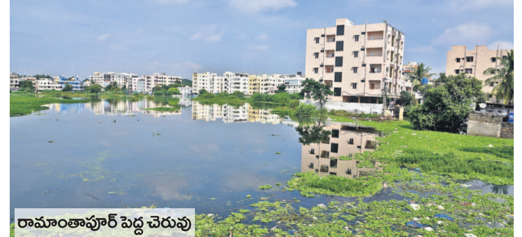
రామాంతాపూర్ పెద్ద చెరువు

సిటీబ్యూరో, అక్టోబర్ 10 (నమస్తే తెలంగాణ) : రాష్ట్రం తాపూర్ పెద్ద చెరువు హద్దుల వ్యవహారంలో హెచ్ఎండ్ఎ లెక్క విభాగానికి చివాట్లు పడుతున్నాయి. తాజాగా పెద్ద చెరువు బఫర్ జోన్, ఎఫ్ఐఎల్ నిర్ధారించాలని హైకోర్టులో ప్రజా ప్రయోజన వ్యాజ్యం దాఖలయ్యింది. దీనిపై విచారణ జరిగింది. రెండు దశల్లోగా రాష్ట్రం తాపూర్ పెద్ద చెరువు కట్టాల, ఆక్రమణలతో బఫర్ జోన్, ఎఫ్ఐఎల్ కు చివాట్లు పడుతున్నాయి. ఇప్పటికే స్థానికులు చెత్తాచెదారం నింపడంతో కట్టాల నిత్యక్షయంగా మారడంతో.. హద్దుల నిర్ధారణ జరగాలన్నారు. 2016లో ఇరిగేషన్, రెవెన్యూ అధికారులు పరిశీలించి.. 30 ఎకరాల మేర విస్తరించి ఉండని.. పైమరీ నోటిఫికేషన్ జారీ చేశారు. కానీ ఇప్పటికే పైమరీ నోటిఫికేషన్ ప్రక్రియ పూర్తి కాలేదని హైకోర్టుకు వివరించారు. ఈ క్రమంలో హెచ్ఎండ్ఎ లెక్క విభాగం అధికారులు తక్షణమే పెద్ద చెరువు హద్దులను నిర్ధారించాలని, చెరువు ఎఫ్ఐఎల్ 30 ఎకరాలు ఉండాలిగా లేదా అనే విషయాన్ని స్పష్టం చేస్తూ తుది నోటిఫికేషన్ జారీ చేయాలని హైకోర్టు ఆదేశించింది. ఇక స్థానికుల నుంచి వచ్చే అభ్యంతరాలను కూడా పరిగణనలోకి తీసుకోవాలని సూచించింది.