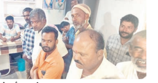
వెల్లండ బీఎంసీయూలో నిరసన తెలుపుతున్న పాడి రైతులు

పోస్ట్ మాస్టర్ సస్పెన్షన్ రైతు ఫిర్యాదుతో అధికారుల విచారణ అలంపూర్లో 1,200 పోస్టులు పెండింగ్లో ఉన్నట్లు గుర్తింపు గట్టు, అక్టోబర్ 10 : పచ్చె పోస్టులన్నీ తన వద్దే ఉంచుకొని పోస్టుమాస్టర్ ఇబ్బంది దుకు గురిచేస్తున్నాడని మండలంలోని అలంపూరు చెందిన పోస్ట్ మాస్టర్ పై ఓ రైతు ఉన్నతా డారులకు ఫిర్యాదు చేశాడు. పోస్టులకు, అధికారులు, పోస్టులకు ఇలా పోస్టు వచ్చిన వాటిని వినియోగ దారులకు వ్యయం లేదని తెలిపారు. ఈ విషయంపై గురువారం జిల్లా పోస్టల్ అధికారి విజయ జ్యోతి గ్రామానికి చేరుకొని విచారణ చేపట్టారు. దాదాపు 1,200 పోస్టులు పోస్టుమాస్టర్ వద్దే ఉన్నట్లు గుర్తించారు. నెల తరబడి పంపిణీ చేయకపోవడంతో పోస్టుమాస్టర్ ను సస్పెండ్ చేస్తూ ఉత్తర్వులు జారీ చేశారు.