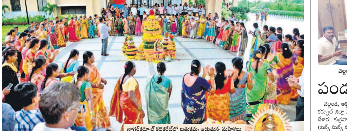
నాగర్ కర్నూల్ కలెక్టరేట్లో బతుకమ్మ ఆడుతున్న మహిళలు