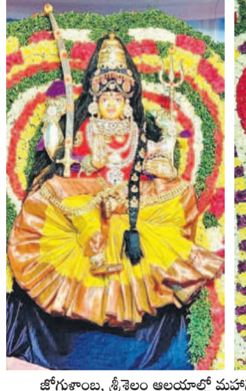
జోగుళాంబ, శ్రీవైలం అంశాల్లో మహాగౌరీగా దర్శనమిస్తున్న అమ్మవారు