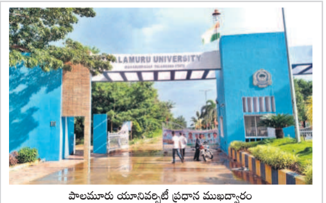
పాలమూరు యూనివర్సిటీ ప్రధాన ముఖద్వారం

పంట నూనెలు సలసల పంట నూనెల ధరలు సలసల కాగుతున్నాయి. దిగుమతులు కేంద్ర ప్రభుత్వం సుంకం పెంచడంతో కంపెనీలు ధరలను అమాంతం పెంచాయి. దీంతో కేవలం రెండు వారాల వ్యవధిలోనే లీటర్ నూనెలపై రూ.20 నుంచి రూ.30 వరకు ధర పెరిగింది. సన్నపప్పు అయితే లీటర్ ధర రూ.130, పామాయిల్ లీటర్ ధర రూ.125కు చేరింది. దీంతో సామాన్యుడి భారం పడింది. దేశీయంగా తయారయ్యే సోయాబీన్, వేరు శనగ, రైస్ బ్రాన్ అయితే ధరలు విదేశీ ఉత్పత్తులతో సమానంగా ధరలు పెంచారు. గత నెల ఇదే సమయానికి రైస్ బ్రాన్ లీటర్ ధర రూ.115 నుంచి రూ.120 వరకు ఉండగా.. నెల రోజుల్లో అదే ప్రస్తుతం రూ.135 మార్కెటు దాటింది. ఇక పల్లె అయితే విషయానికొస్తే రూ.170 నుంచి రూ.180 వరకు ధర మార్కెట్లో ఉన్నది. దిగుమతి సుంకం పరి ధోరణి రాని దేశీయ నూనెల ధరలు సైతం పెంచడంతో సామాన్యులు బెంబేలై పోతున్నారు.