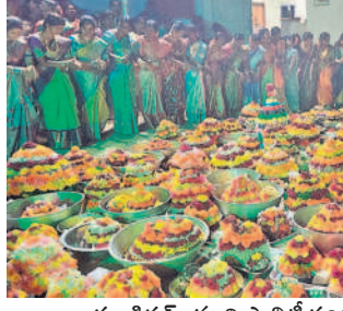
దుండిగల్ : మున్సిపాలిటీ పరిధిలోని శంభీపూర్ లో ...

ఫునంగా సద్దుల బతుకమ్మ వేడుకలు - కూకట్‌పల్లి పరిసర ప్రాంతాల్లో సద్దుల బతుకమ్మ వేడుకలు అంగరంగ వైభవంగా సాగాయి. కూకట్ పల్లి గ్రామంలోని హనుమాన్ దేవాలయం, రామాలయం, కేపీహెచ్.బి కాలనీ 9వ ఫేజీ బతుకమ్మకుంట్ల, సర్దార్ పట్టణ్, వసంతనగర్, శ్రీరామార్యు వైడే, బాలాజీనగర్ కాలనీ, మూసాపేట, గోపాలనగర్, పూలతో పేర్చిన బతుకమ్మలు అందరినీ ఆకట్టుకున్నాయి. శ్రీరామారామ రామ ఉయ్యాలలో, జయరామారామ రామ ఉయ్యాలలో అంటూ ఆటాపాటలతో ఆడమడమలు సందడి చేశారు. పాటుకు చుట్టూనే చేర్చే కాళ్లను లయ బద్ధంగా కడుపుతూ ఆడిన బతుకమ్మ ఆటలు సందడిగా మారాయి. బతుకమ్మలను చెరువుగట్టుకు ఊరేగింపుగా తీసుకెళ్లి చెరువుగట్టుపై మరలా ఒక సారి బతుకమ్మ ఆటలు ఆడారు. బతుకమ్మలతో పాటు గౌరవ్యులను చెరువులో నిమజ్జనం చేసి ప్రసాదాలను ఇచ్చిస్తున్నారన్నారు. పోయూ గౌరవ్యుల పోయూ పూజా యేదా తిరిగిరావమ్మ అంటూ పాటపాడుతూ గౌరవ్యులు, బతుకమ్మను పుట్టింటికి సాగసంపారు.