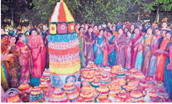
గద్దెపాలెం బీఎన్ జేఎం ఆధ్వర్యంలో...