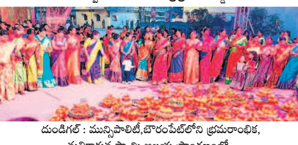
దుండిగల్ : మున్సిపాలిటీ, బొరంపేట్ లోని భ్రమరాంబిక, మల్లికార్జున స్వామి ఆలయ ప్రాంగణంలో..