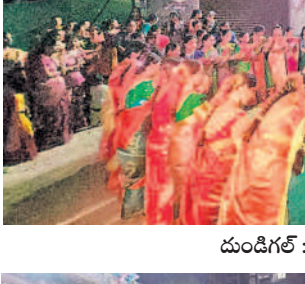
దుండిగల్ : మున్సిపాలిటీ పరిధిలోని శంభీపూర్ లో ..