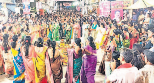
బాలాజీనగర్ లో ..