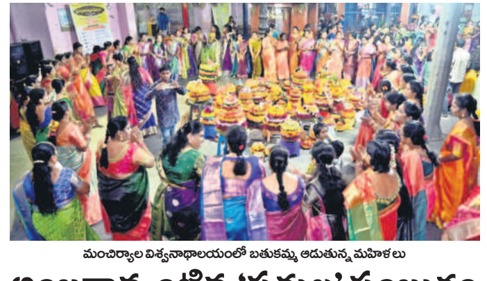
మంచిర్యాల విశ్వనాథాలయంలో బతుకమ్మ ఆడుతున్న మహిళలు