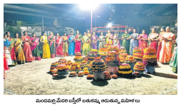
మందవల్లిమేదరి బస్తీలో బతుకమ్మ ఆడుతున్న మహిళలు