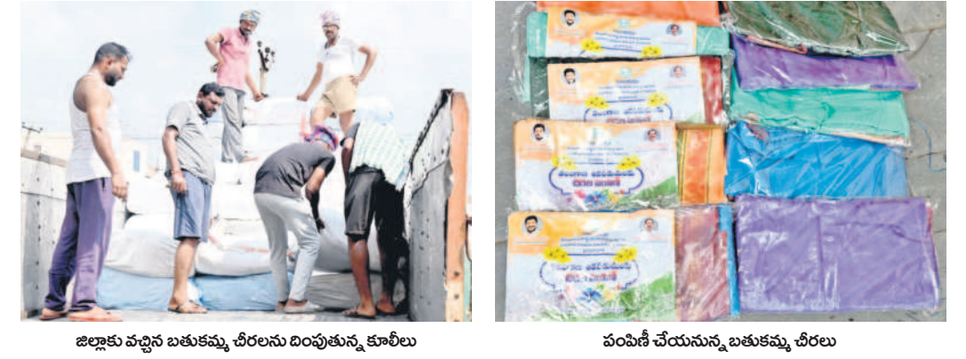
జిల్లాకు వచ్చిన బతుకమ్మ చీరలను దింపుతున్న కూలీలు | పంపిణీ చేయనున్న బతుకమ్మ చీరలు